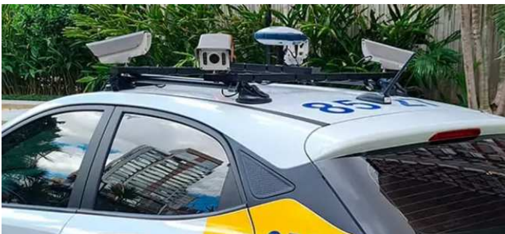
2 IMAGEM ILUSTRATIVA

Deverá ser disponibilizado no mínimo, um veículo automotor de 4 rodas, 4 ou 5 lugares, ou motocicleta, equipados com câmeras de alta resolução, dispostas em ângulos que propiciem leitura das placas em ambos os lados das vias, nos sentidos frontal e traseiro.