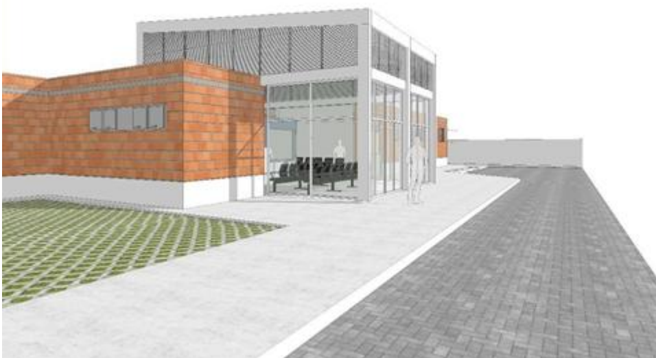
Figura 02 – Perspectiva