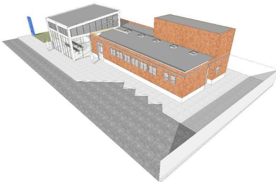
Figura 03 – Perspectiva