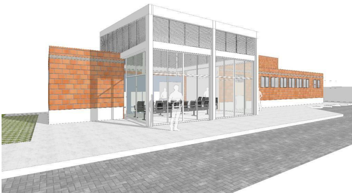
Figura 04 – Perspectiva