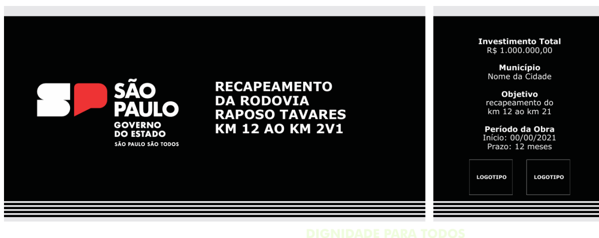
Figura 05 – Modelo de Placa (1,5 x 4,0) 6 m2

Obs: A contratada, antes de confeccionar a placa, deverá submeter à apreciação da Secretaria Municipal de Planejamento Urbano e Obras para a aprovação.