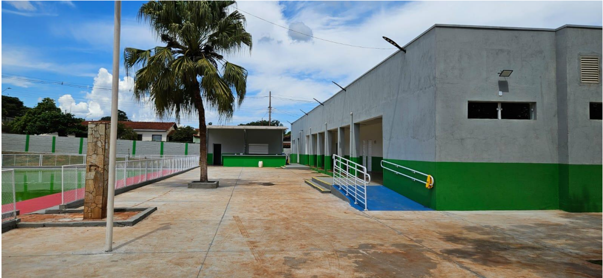
Imagem 11: Área destinada ao público

Prefeitura Municipal de Aramina - Rua: Dr. Bráulio de A. Junqueira – 795 - CNPJ: 45323474/0001-02 Telefone: (16) 3752-7000 / (16) 3752-7006 - E-mail: engenharia@aramina.sp.gov.br