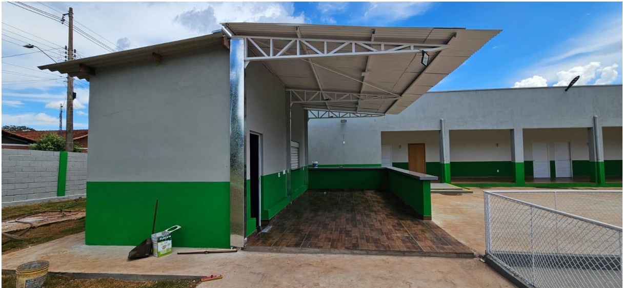
Imagem 05: Área da varanda de atendimento

Prefeitura Municipal de Aramina - Rua: Dr. Bráulio de A. Junqueira – 795 - CNPJ: 45323474/0001-02 Telefone: (16) 3752-7000 / (16) 3752-7006 - E-mail: engenharia@aramina.sp.gov.br