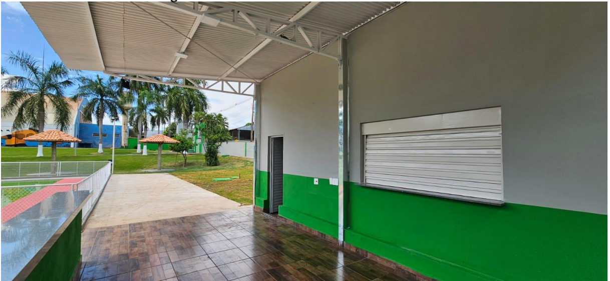
Imagem 03: Área da varanda de atendimento