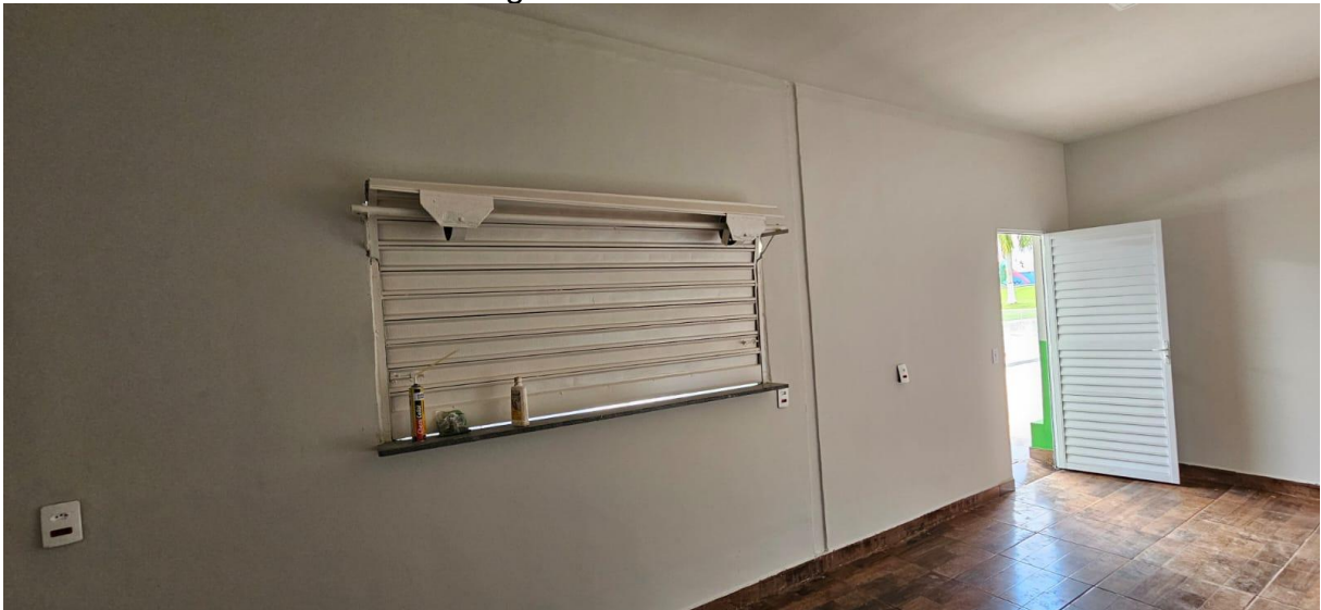
Imagem 09: Cozinha do bar