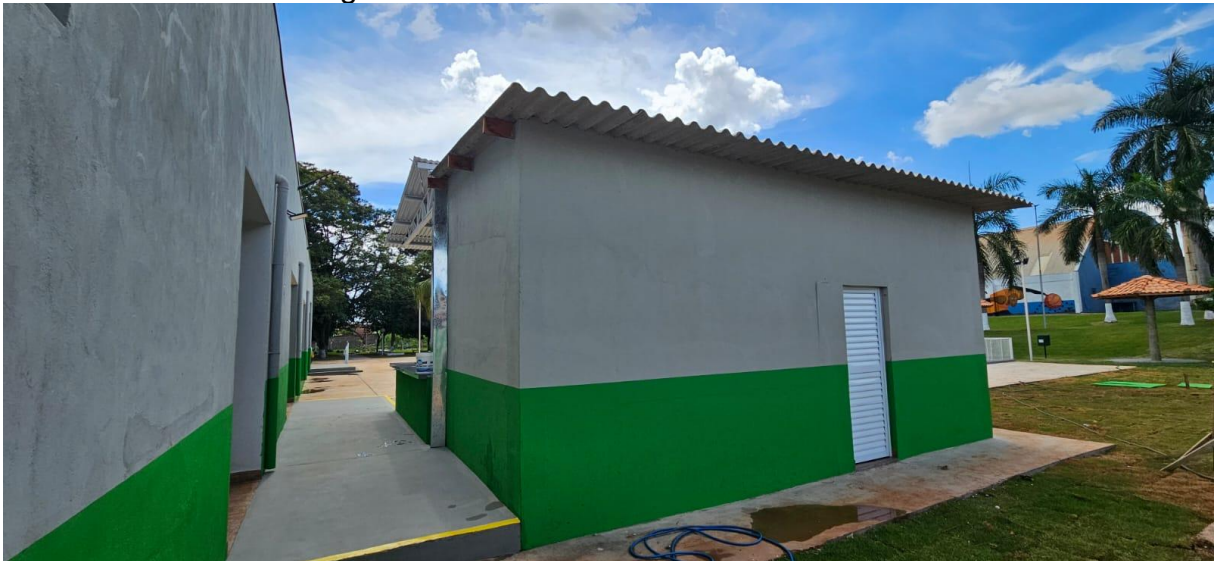
Imagem 06: Área posterior do bar