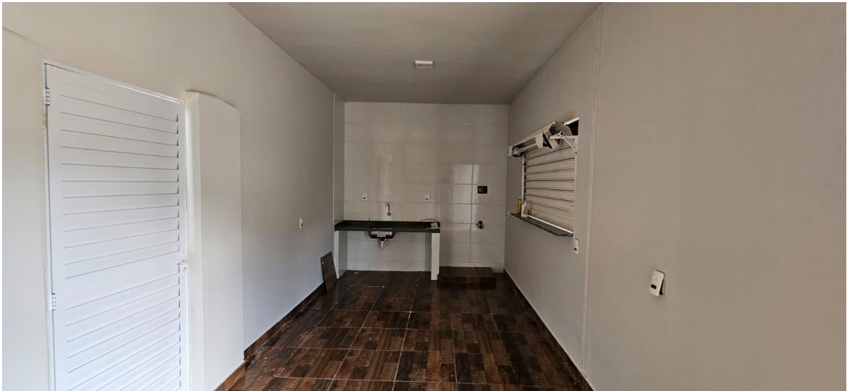
Imagem 08: Cozinha do bar

Prefeitura Municipal de Aramina - Rua: Dr. Bráulio de A. Junqueira – 795 - CNPJ: 45323474/0001-02 Telefone: (16) 3752-7000 / (16) 3752-7006 - E-mail: engenharia@aramina.sp.gov.br