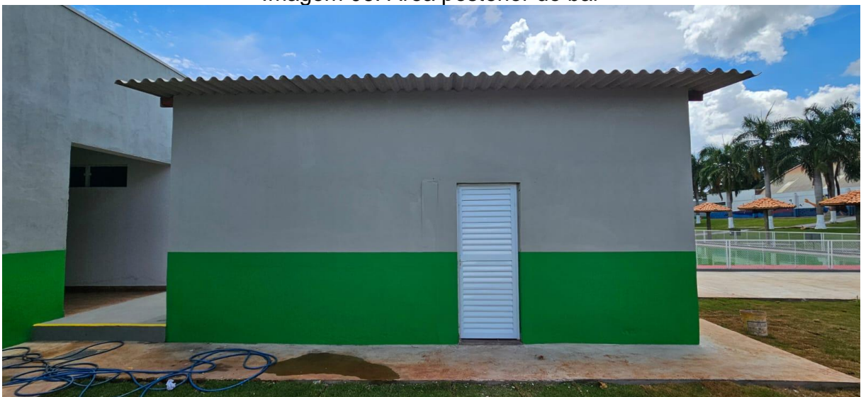
Imagem 07: Área posterior do bar