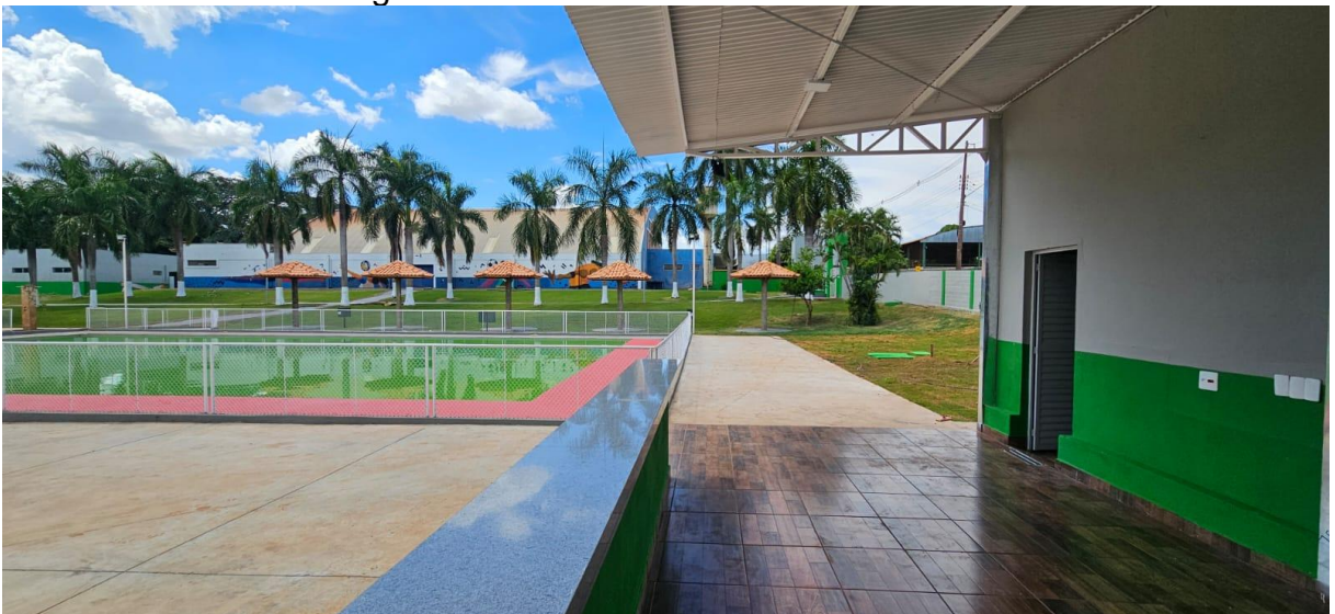
Imagem 04: Área da varanda de atendimento