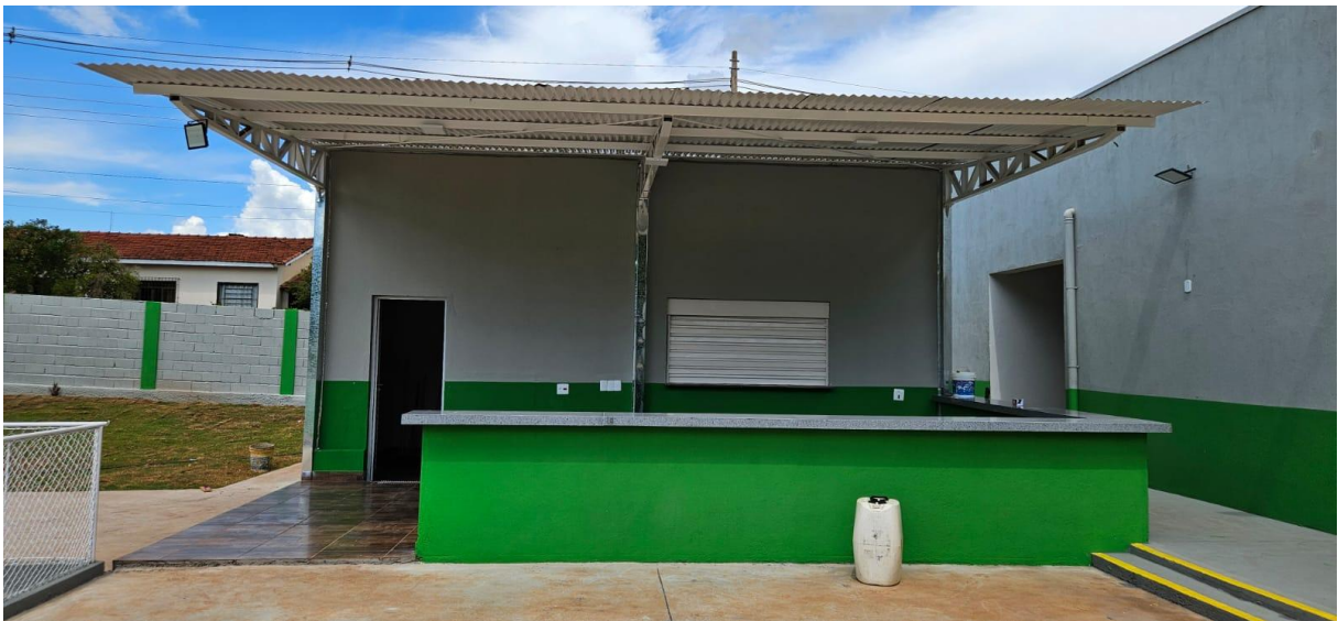
Imagem 01: Área da varanda de atendimento