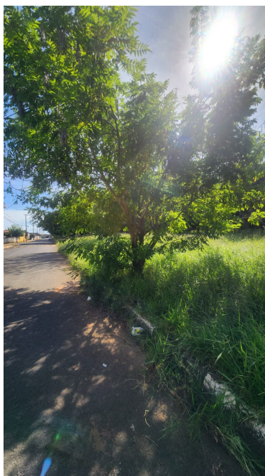
Calçada a construir na Rua Antonio Salvato

O objeto deverá ser executado em conformidade com as especificações descritas em Projeto, Planilha Orçamentária, Memorial descritivo e Termo de Referência, respeitando os prazos e condições estabelecidos no contrato. A execução será acompanhada e fiscalizada pela Administração, garantindo o cumprimento integral do objeto, a observância da legislação aplicável e a promoção do interesse público.