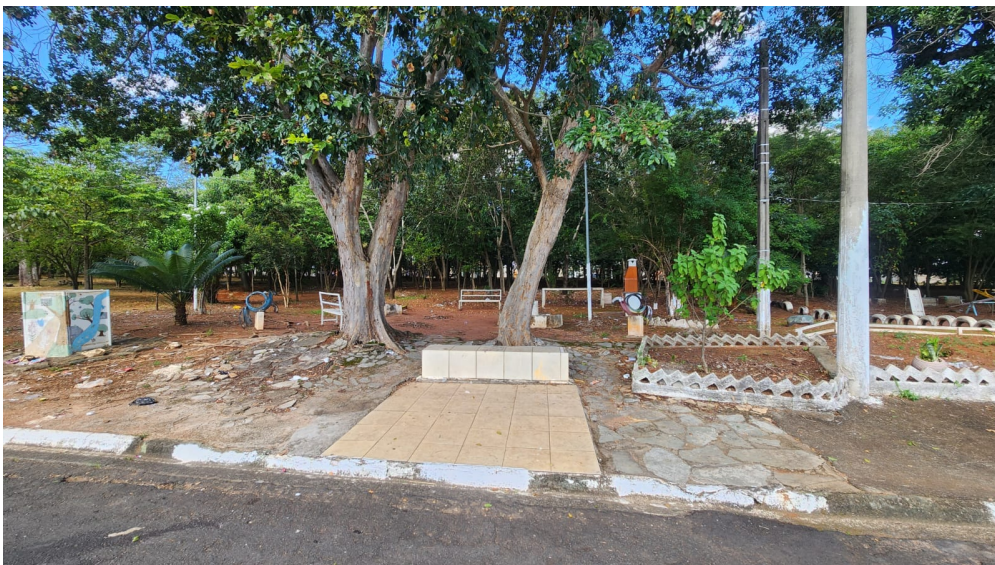
Banco a reformar