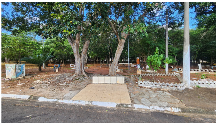
Banco a reformar