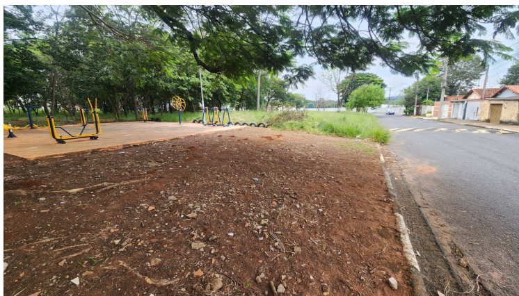
Calçada a construir na Rua Cap. Everton Braga Corteletti e acesso á academia existente