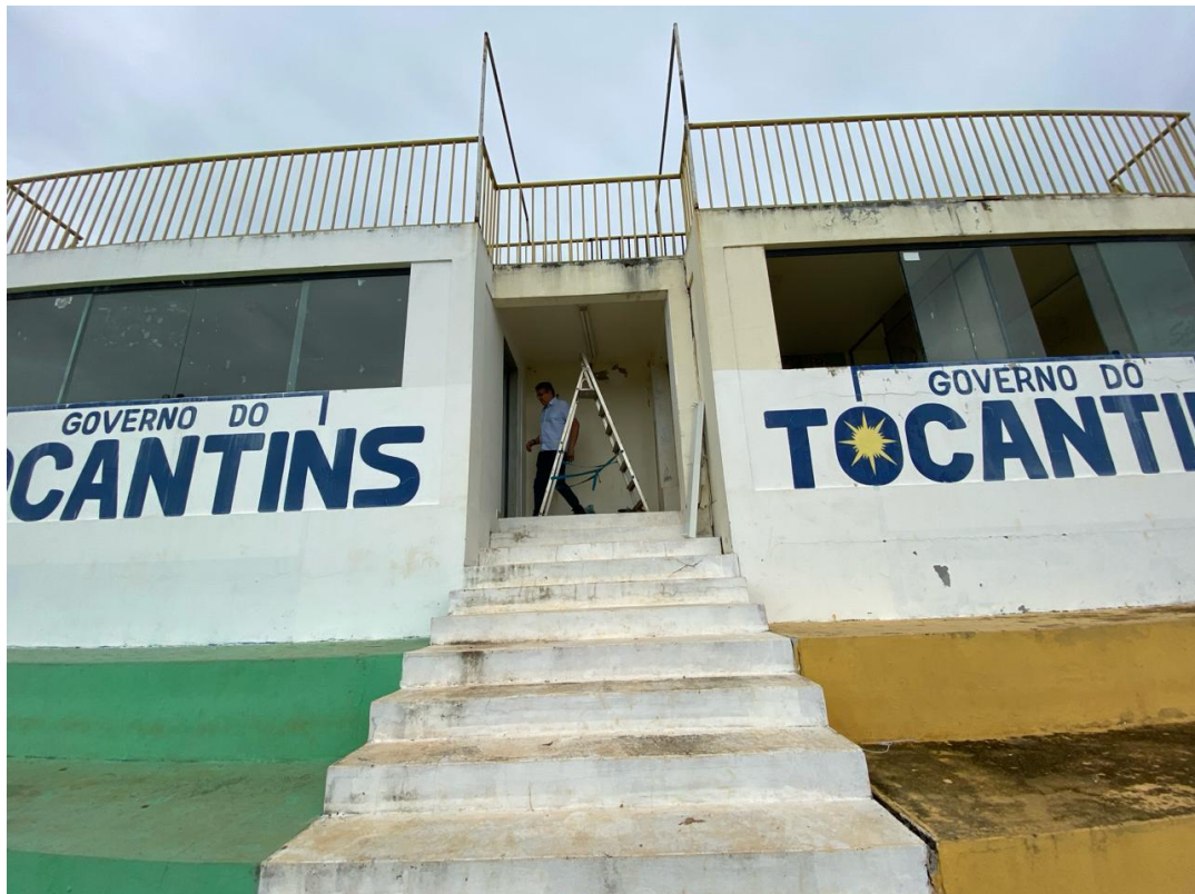
Figura 2: Vista acesso às cabines para assistentes

ASSINADO POR LOGIN E SENHA POR: ATOS GOMES DE ARAUJO EM 20/03/2026 13:07:28