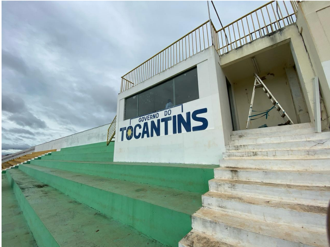
Figura 1: Vista da arquibancada