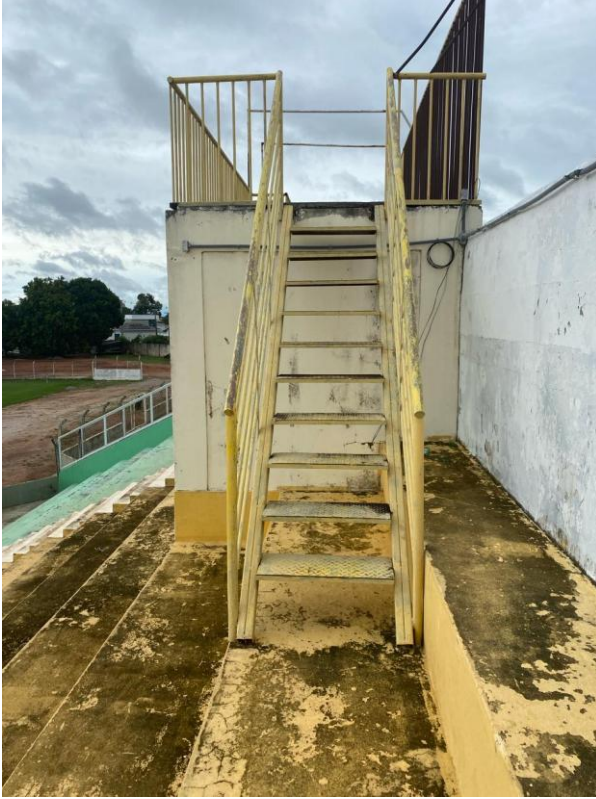
Figura 4: Vista escada acesso para laje acima da cabine