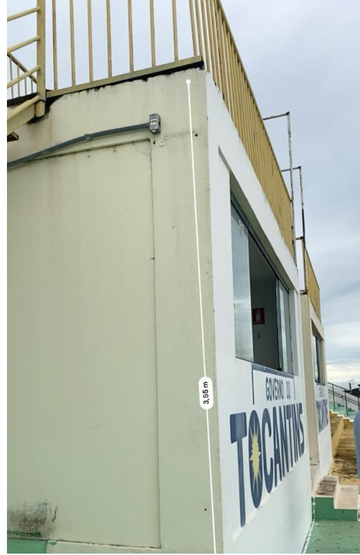
Figura 3: Vista perspectiva cabines