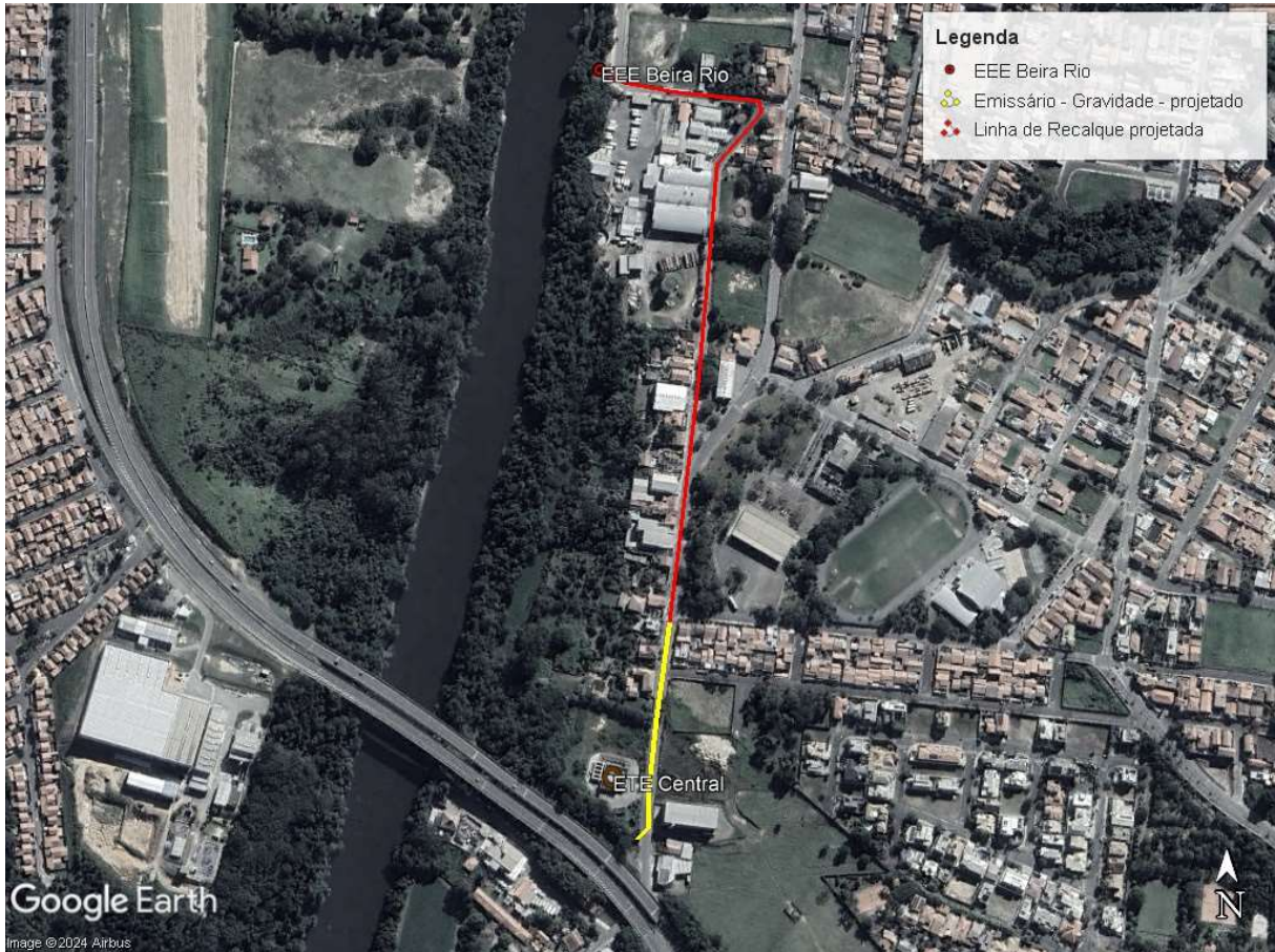
Figura 6. Localização do empreendimento.

A Figura 7 apresenta a foto aérea de parte do município de Tietê, com sobreposição da delimitação de ambas as bacias de contribuição. Foram indicados as estações elevatórias e respectivas linhas de recalque, a serem implantadas, o emissário Beira Rio, em implantação, e a ETE Central existente.