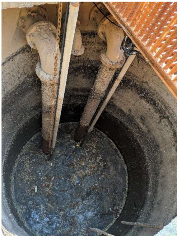
Figura 3. EEE Beira Rio existente.