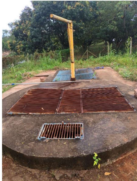
Figura 2. EEE Beira Rio existente.