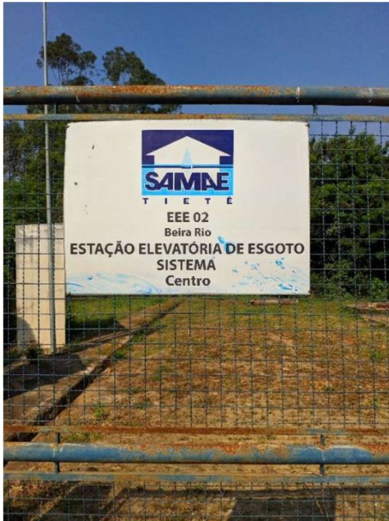
Figura 1. EEE Beira Rio existente.