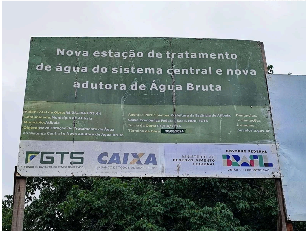
Imagem 4 - Placa com pintura em sua superfície

1.3. Os bens objeto desta contratação são caracterizados como comuns, ou seja, possui padrões de desempenho e qualidade que podem ser objetivamente definidos pelo edital, por meio de especificações usuais de mercado, conforme art. 29 da Lei 14.133/2021.