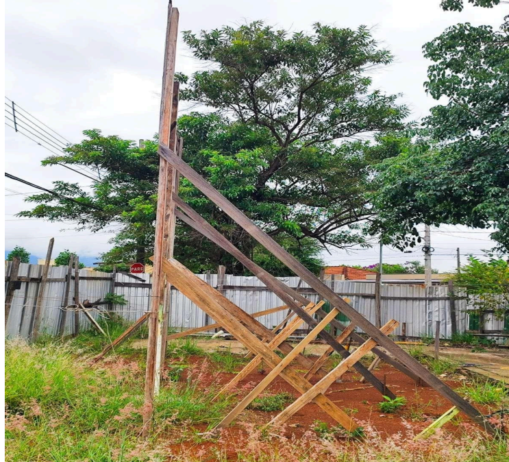
Imagem 1 - Terreno