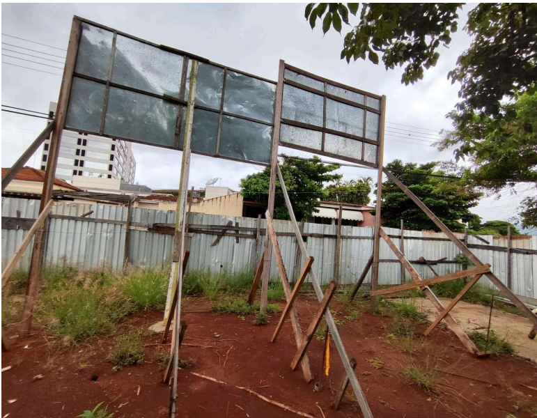
Imagem 2 - Terreno