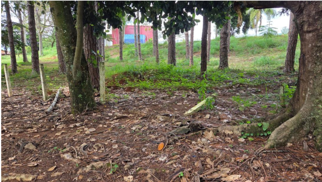
Figura 39 – Situação atual da faixa lateral da estrada.