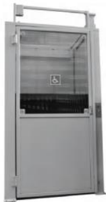
T100086 Hidráulica, com capacidade de carga de 250Kg