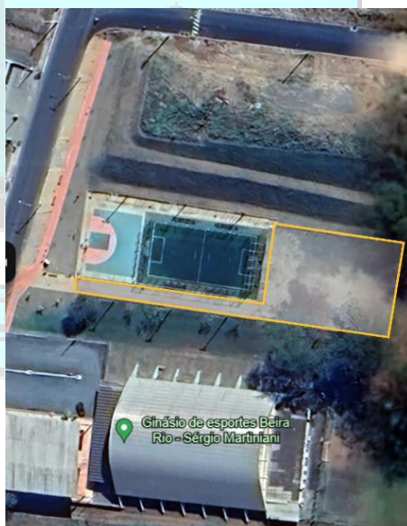
Campo gramado de Futebol Beira Rio

O plantio da grama poderá ser executado em outros locais conforme necessidade da Prefeitura, garantindo assim a urbanização e ambientação dos mesmos, bem como evitar erosão e a contenção de taludes, que conseqüentemente podem causar danos ao projeto urbanístico do local.