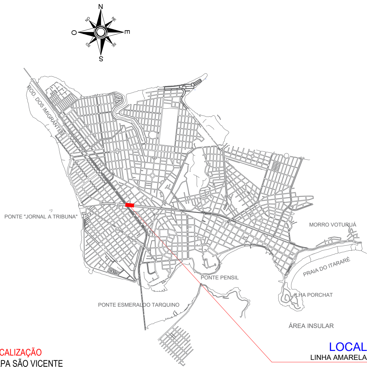
LOCALIZAÇÃO MAPA SÃO VICENTE ESCALA