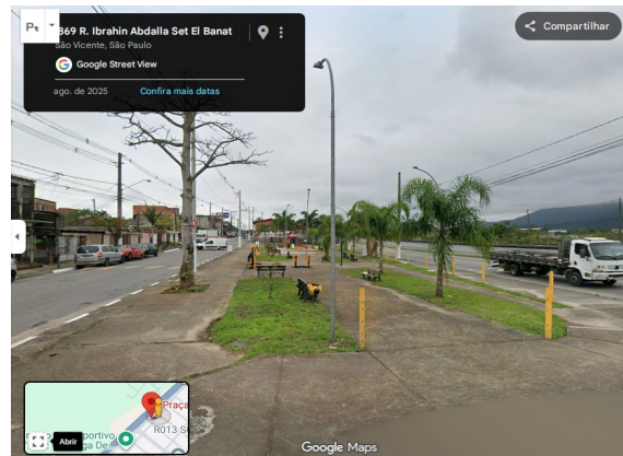
Imagem 02 – Rua Ibrahin Abdalia Set. El Banat