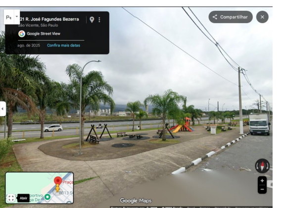
Imagem 03 e Imagem 04 – Vistas pela Rua José Fagundes Bezerra