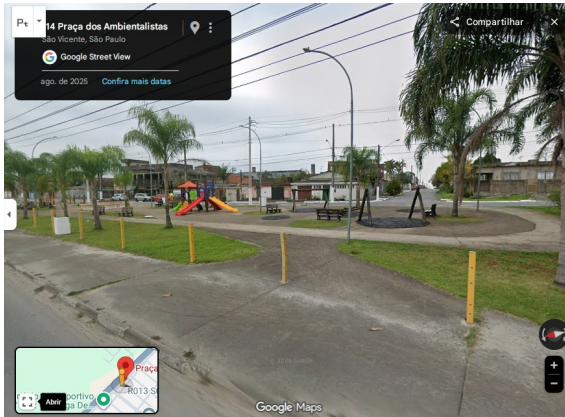
Imagem 01 – Praça dos Ambientalistas