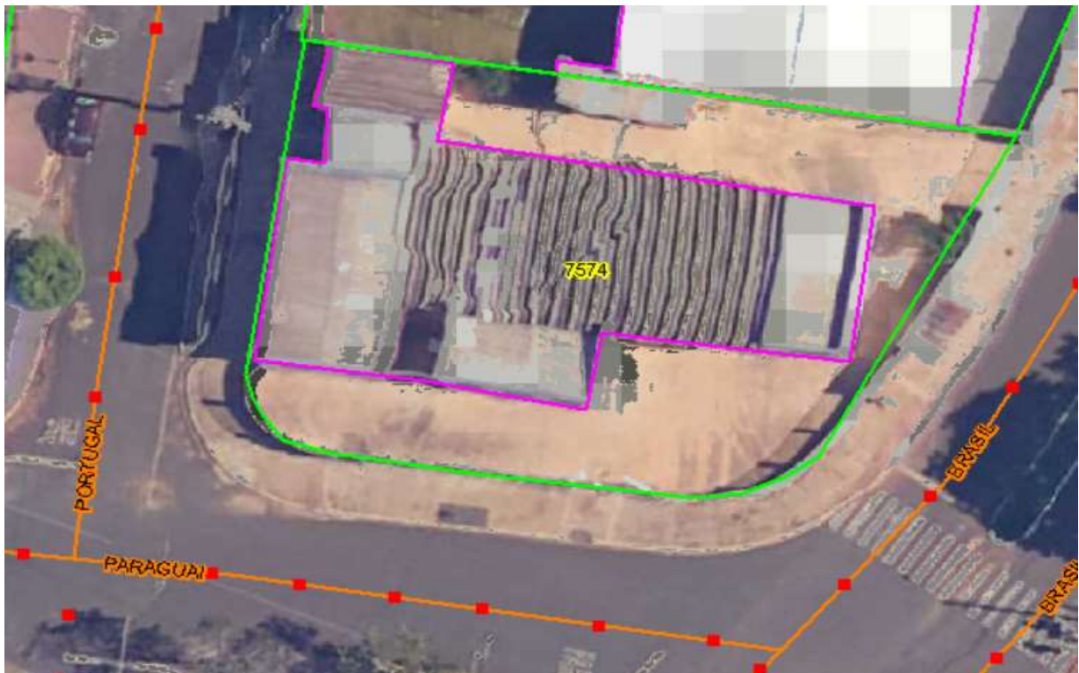
Imagem 1: Imagem de Satélite da localização da edificação.