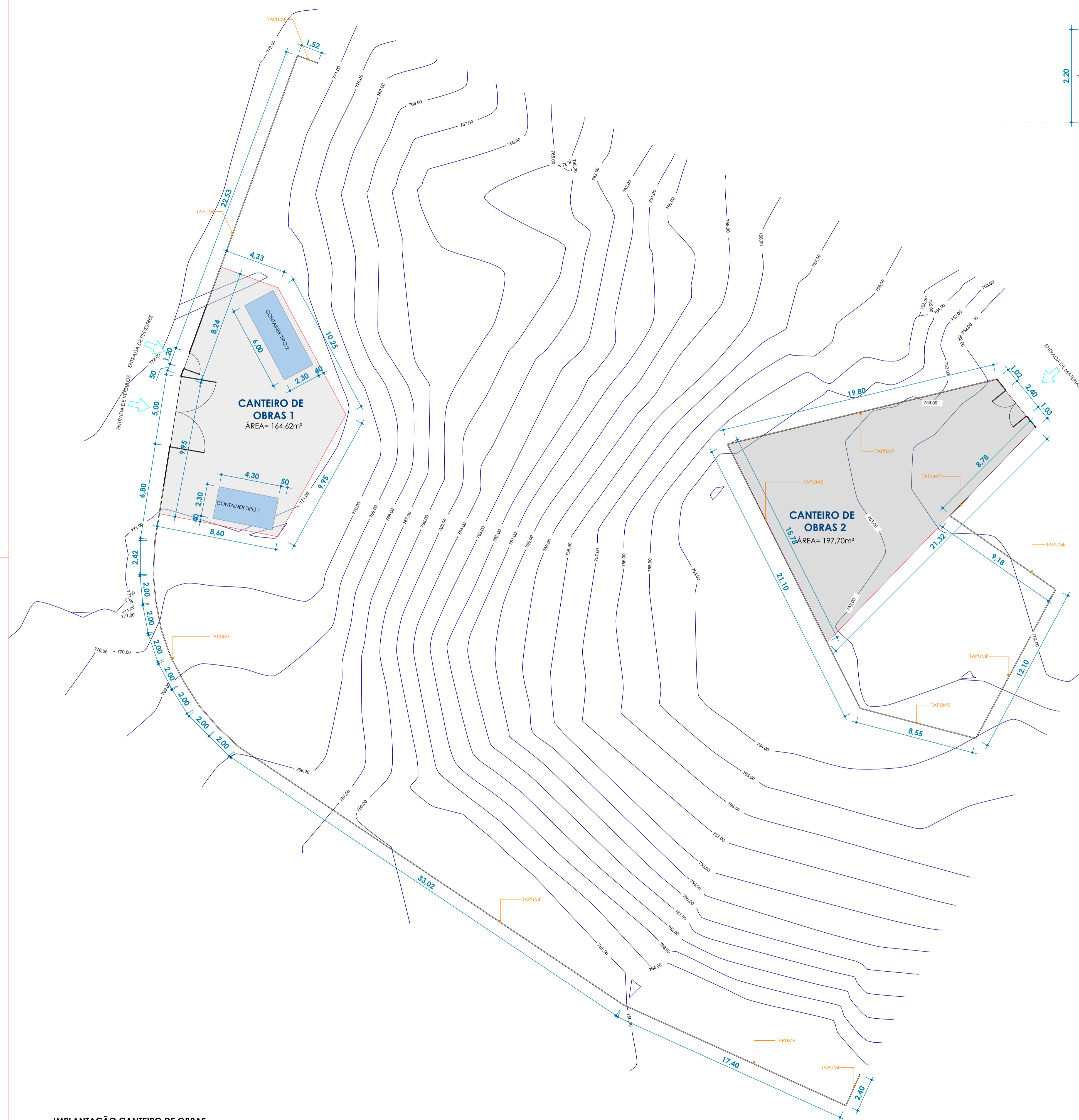
IMPLANTAÇÃO CANTEIRO DE OBRAS ESC: 1 : 150