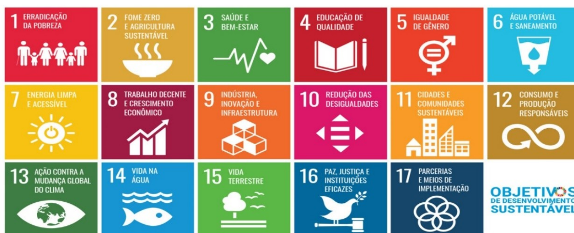
Figura 2 – Quadro das ODS.

A escolha do credenciamento de pessoa jurídica com experiência no ramo, torna-se uma alternativa sustentável pois garante o pleno funcionamento do sistema de coleta seletiva implantado no município, viabilizando a destinação adequada de todo o montante de resíduos recicláveis coletados pela municipalidade, evitando que haja o descarte irregular de resíduos recicláveis e ações corretivas de limpeza e destinação de resíduos, propiciando assim economia de verba pública.