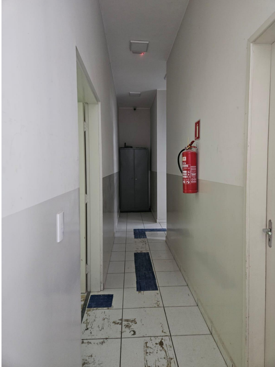
Acesso a ser criado interligado as duas edificações.