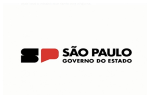
Logo Oficial do Governo do estado de São Paulo