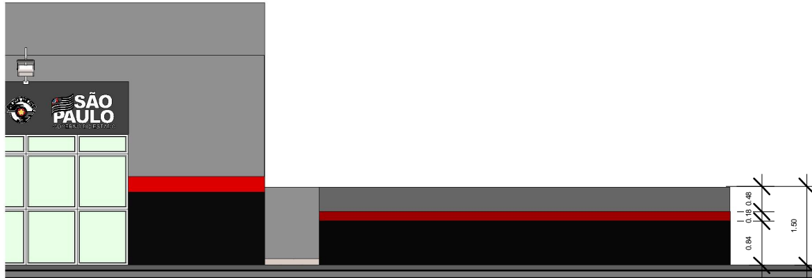
2 Muro h=1,50 m 1 : 100