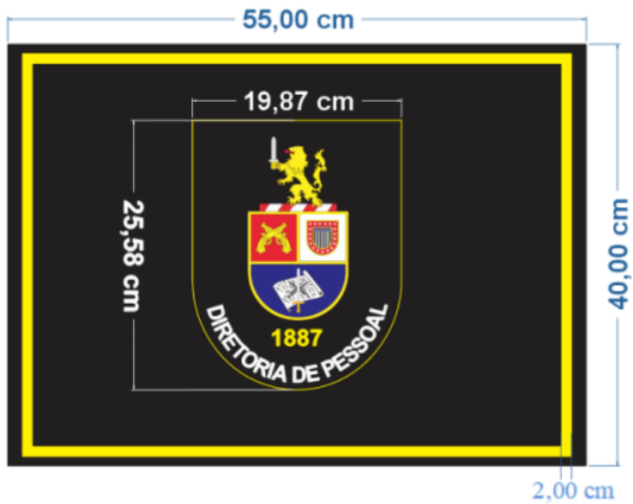
Cetilha Dourada para Almofada