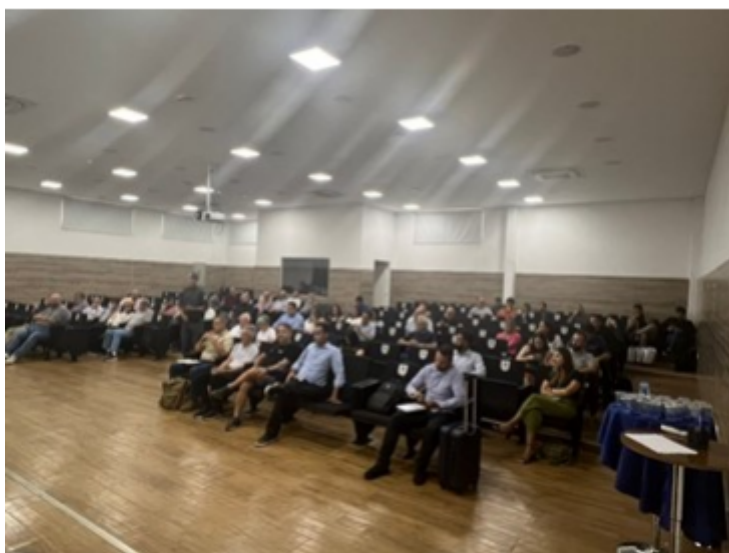
Figura 2: Audiência Pública

5.5. Foram coletados contatos e informações sobre os fardamentos adquiridos pela PMESP através da Audiência Pública realizada em 17 de janeiro de 2024 (Ata nº DL-004/26/24).