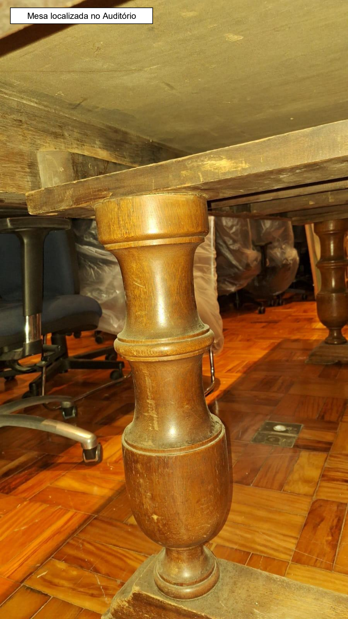
Mesa localizada no Auditório