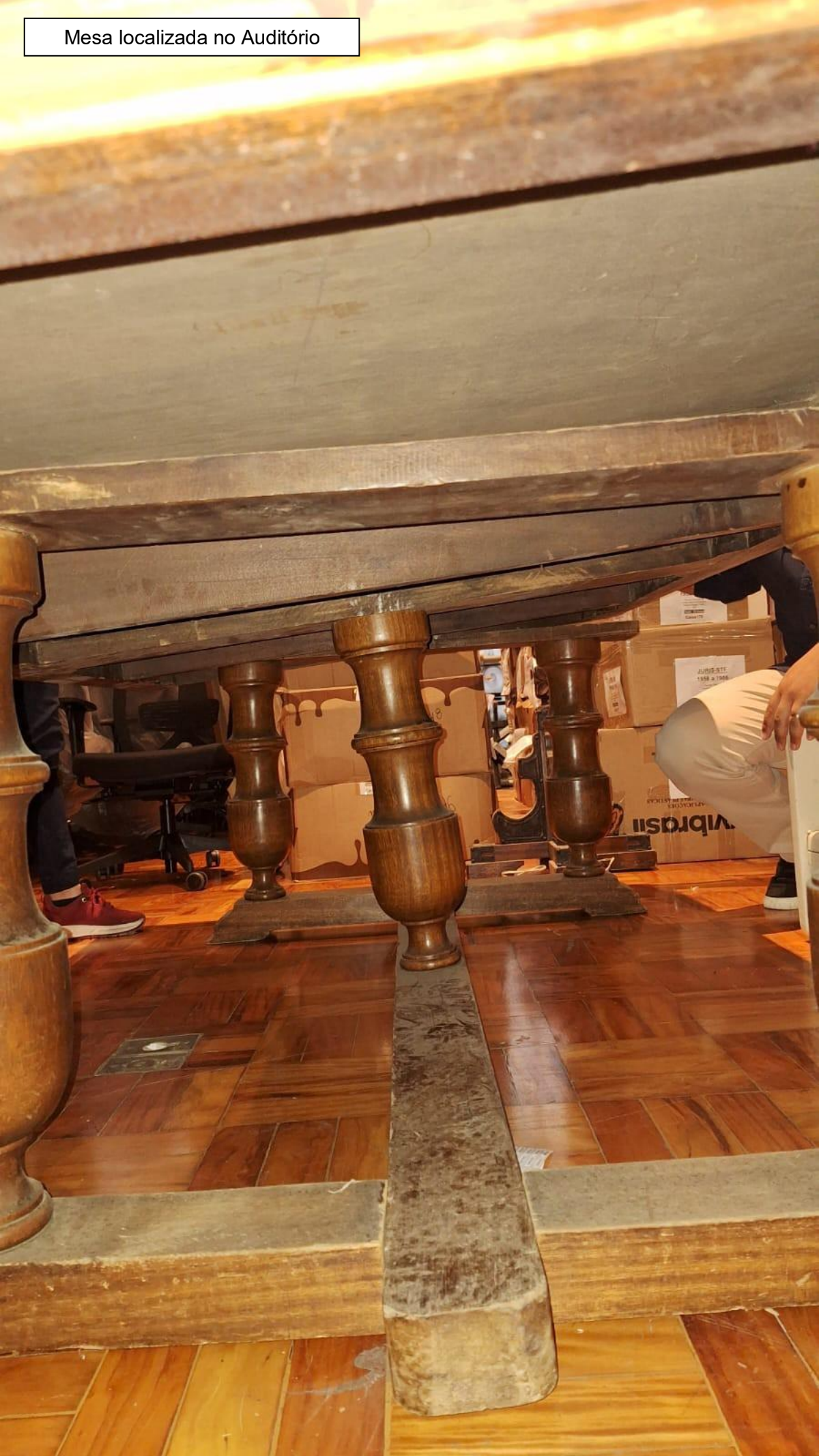
Mesa localizada no Auditório