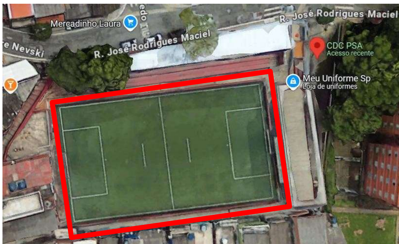
Figura 1 – Localização da região a ser reformada.

Os trabalhos serão executados nas áreas demarcadas, conforme mapa abaixo: