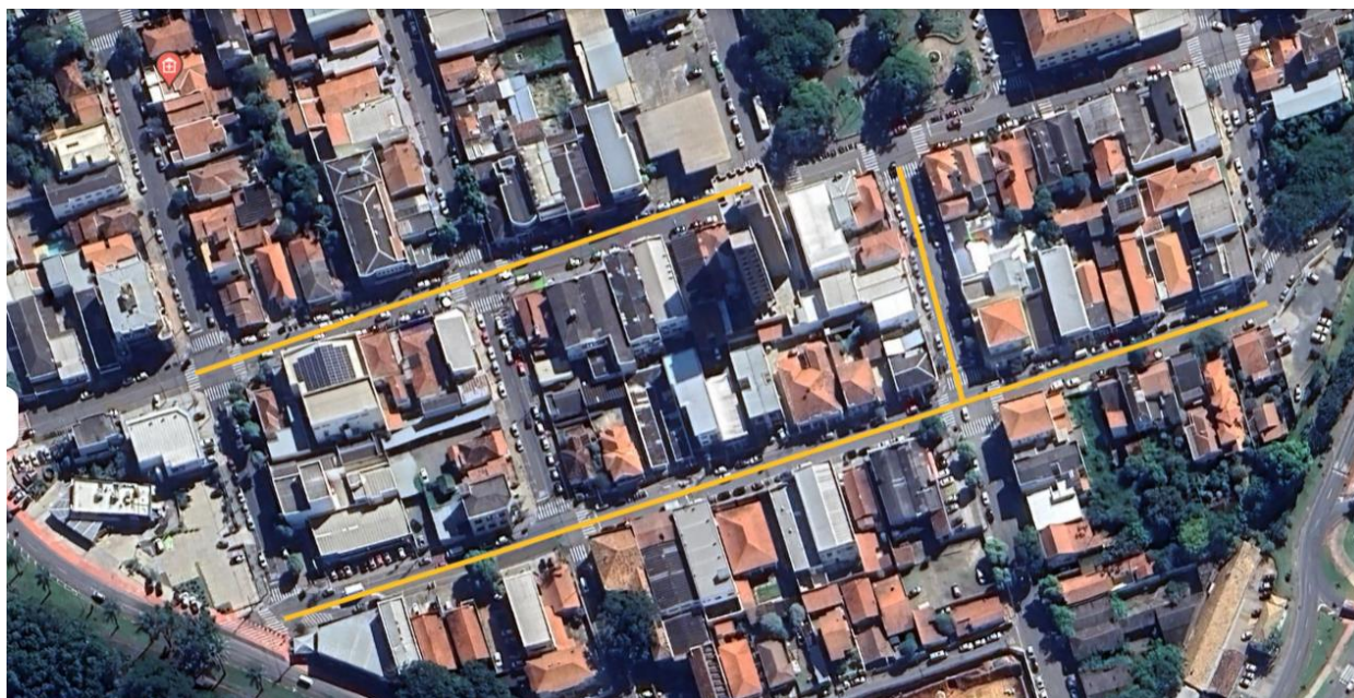
Situação atual - Planta de localização da área de intervenção

O endereço de realização dos serviços é no bairro “Centro”, nas Ruas Alfredo Engler, Cândido Bueno e Coronel Amâncio Bueno, em Jaguariúna, SP. A área a ser intervencionada corresponde ao demarcado conforme planta de localização abaixo: