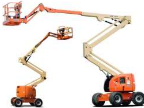
Figuras Ilustrativas 02 e 03 – dimensões aproximadas da plataforma elevatória articulada