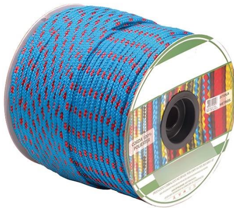
Imagens ilustrativa para referência

Corda com bitola de 4 mm, confeccionada em poliéster de alta resistência, proporcionando resistência mecânica, durabilidade e desempenho adequado para aplicações de uso geral e amarração de cargas.