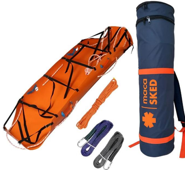
Imagens ilustrativa para referência

Equipamento destinado ao resgate, remoção e transporte de vítimas em ambientes de difícil acesso, incluindo operações em altura, espaços confinados, áreas externas, ambientes naturais e locais restritos.