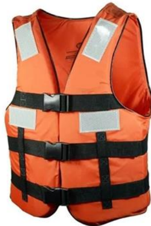
Imagens ilustrativa para referência