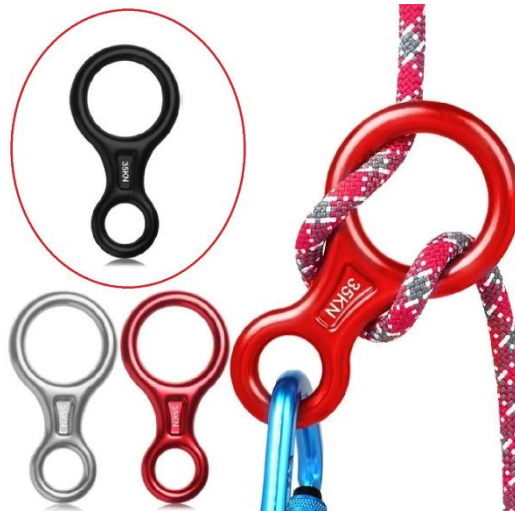
Imagens ilustrativa para referência

Equipamento descensor tipo freio em formato “8”, destinado ao controle de descidas em sistemas de corda utilizados em rapel, acesso por cordas, escalada e operações de resgate em altura.