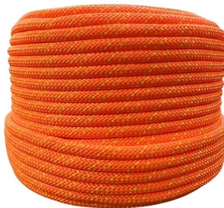
Imagens ilustrativa para referência