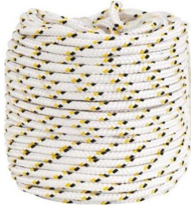
Imagens ilustrativa para referência

Corda confeccionada em polipropileno (PP), indicada para aplicações de uso geral e amarração, apresentando boa resistência mecânica e durabilidade.