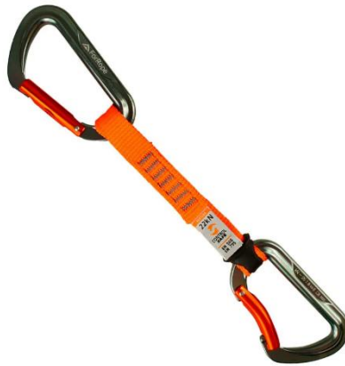
Imagens ilustrativa para referência

Fita expressa costurada indicada para utilização em sistemas de progressão, ancoragem e segurança em atividades verticais, como escalada, acesso por cordas, alpinismo e resgate em altura.