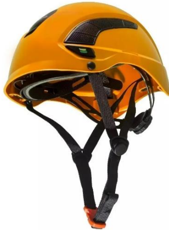
Imagens ilustrativa para referência

Capacete de segurança destinado a operações de resgate em altura, acesso por cordas, trabalho em altura e atividades verticais, do tipo modelo alpinista, projetado para oferecer proteção contra impactos verticais, frontais e laterais, garantindo segurança e estabilidade durante operações técnicas de resgate.