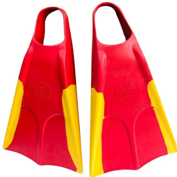
Imagens ilustrativa para referência

Equipamento destinado a operações de salvamento e resgate aquático, utilizado para melhorar o deslocamento do socorrista em ambientes como rios, lagos, represas, mar, piscinas e áreas alagadas.