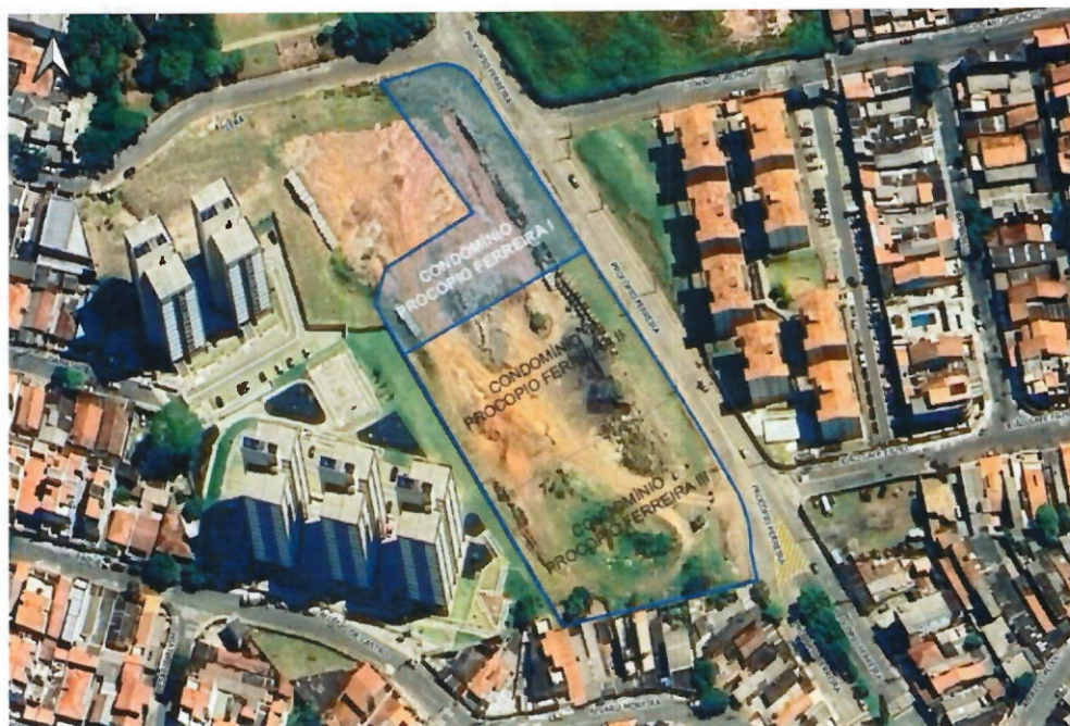
Figura 1: Localização do empreendimento, Santo André.

nos termos do Decreto Municipal n.º 18.243/2024 e Lei Federal n.º. 14.133/2021