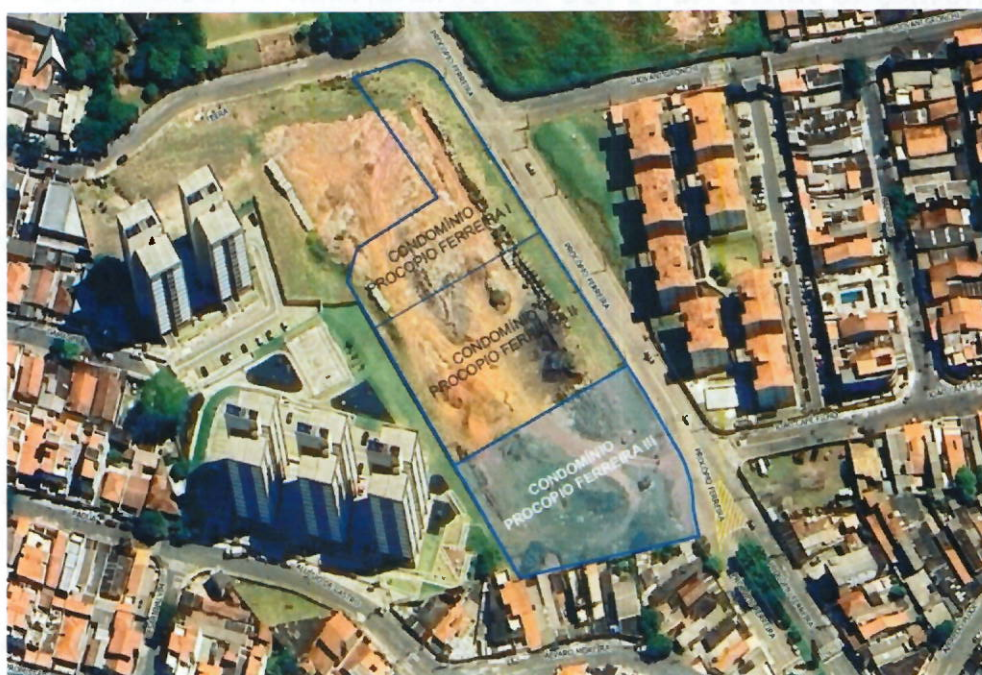
Figura 1: Localização do empreendimento, Santo André.

empreendimentos estão estabelecidas nas Portarias n.º 725/2023 e n.º 489/2025, do Ministério das Cidades (MCID), conforme a localização a seguir: