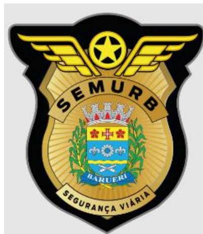
Imagem 06 – Layout do Brasão.