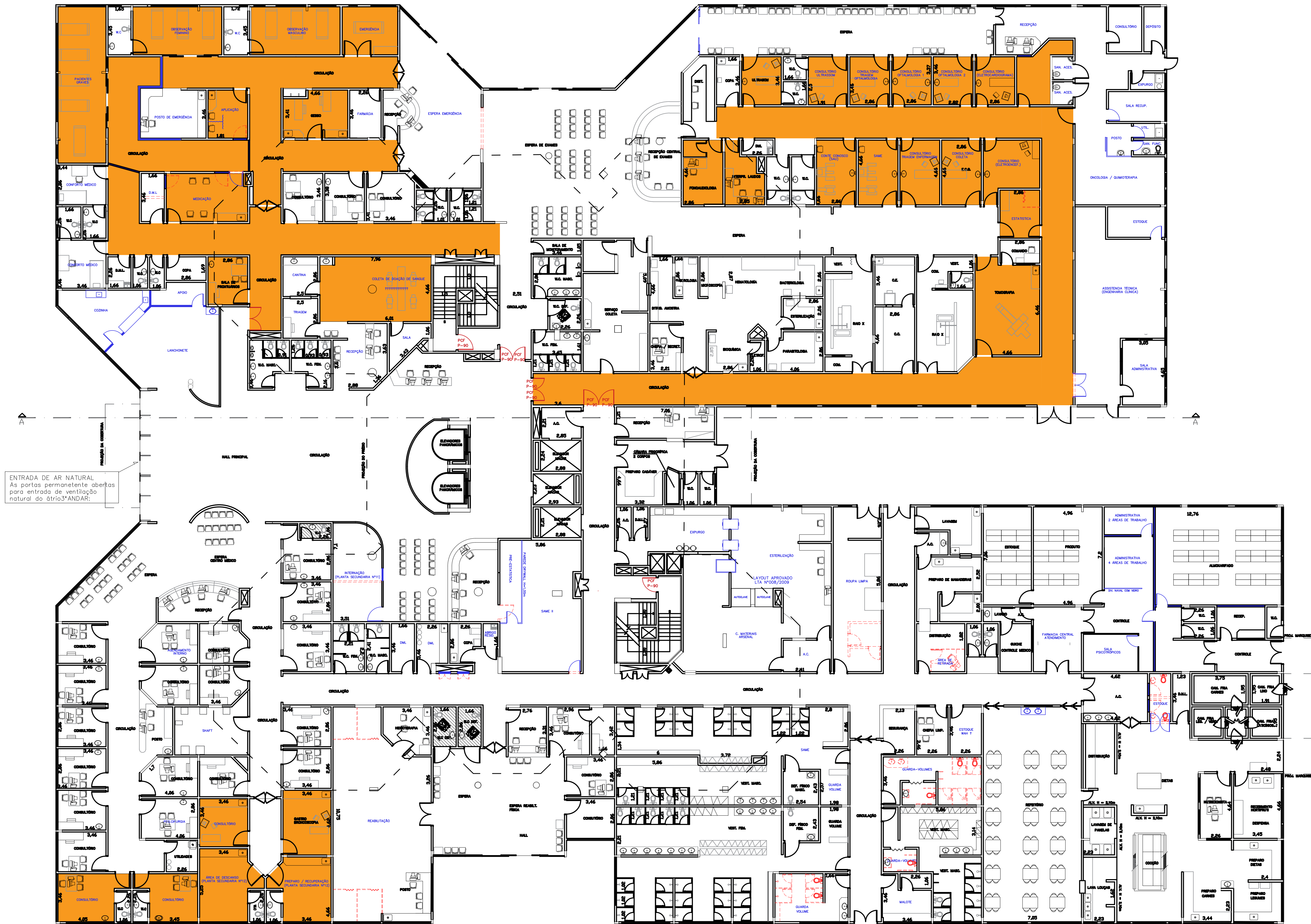
PLANTA PAV. TÉRREO ESCALA 1:150