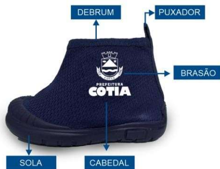
Figura 15 (meramente ilustrativa)

Palmita de acabamento confeccionada na sua parte superior em tecido ou não tecido na cor Preta, unida à base pelo processo filme adesivo e sua base em EVA (Etil, Vinil, Acetado) de espessura mínima 4,5 milímetros, com a finalidade de proporcionar maior conforto ao caminhar e de fácil higienização (removível). Solado composto por borracha termoplástica a base de TR, cujas propriedades atendam as normas técnicas abaixo: