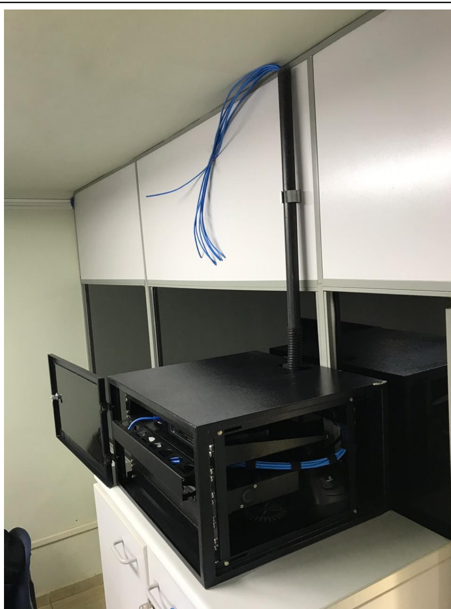
Condute de entrada do cabeamento na parte superior

Prefeitura do Município de Francisco Morato