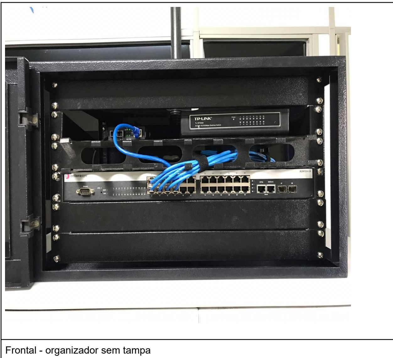
Frontal - organizador sem tampa

Prefeitura do Município de Francisco Morato