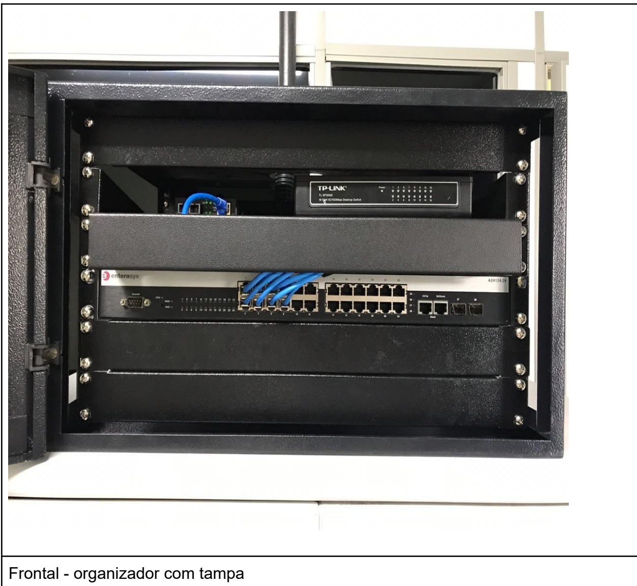
Frontal - organizador com tampa

Prefeitura do Município de Francisco Morato