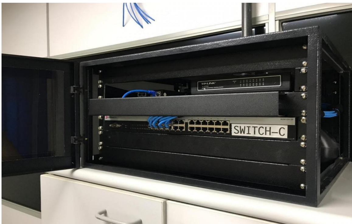
Frente - identificação do switch

7.3.2. Fotos de referência para montagem: