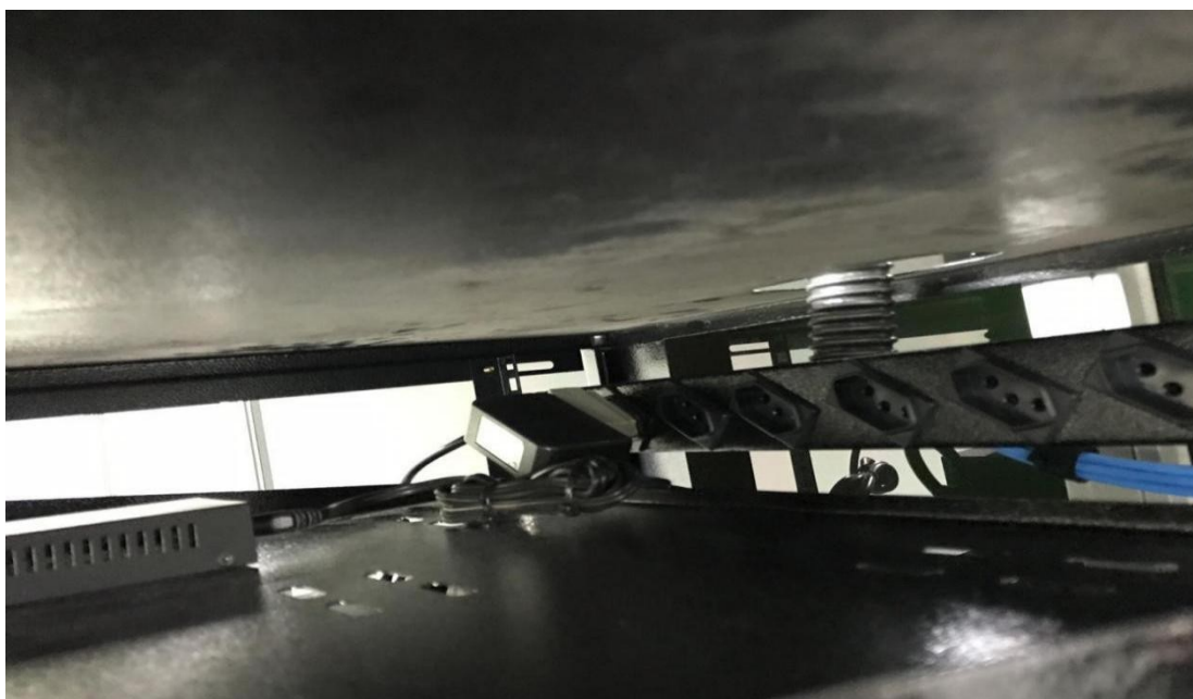
Fundo interno – régua