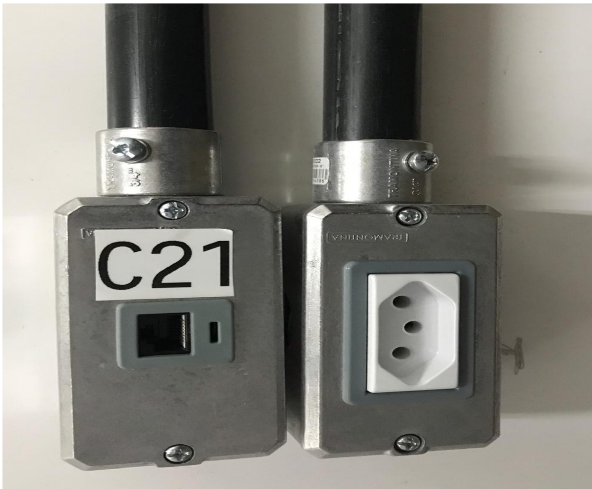
Tomada de rede identificada / Tomada de alimentação elétrica

Prefeitura do Município de Francisco Morato