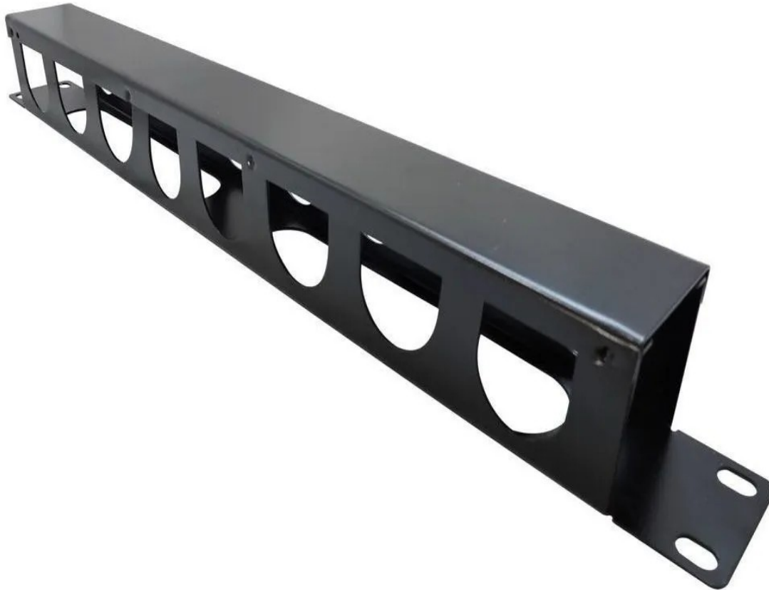
Exemplo - Organizador de Cabos

Prefeitura do Município de Francisco Morato