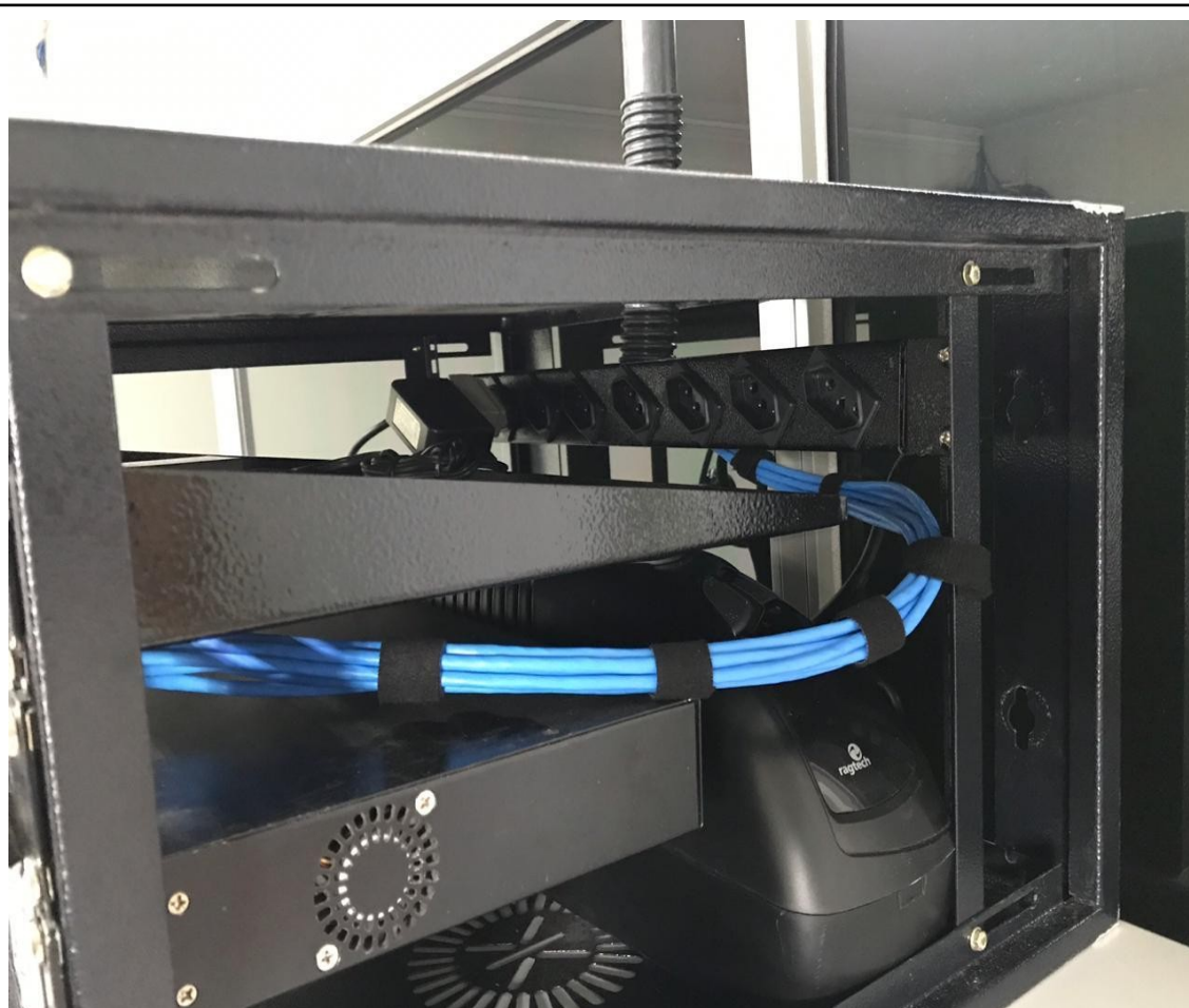
Lateral direita - cabos de rede

Prefeitura do Município de Francisco Morato