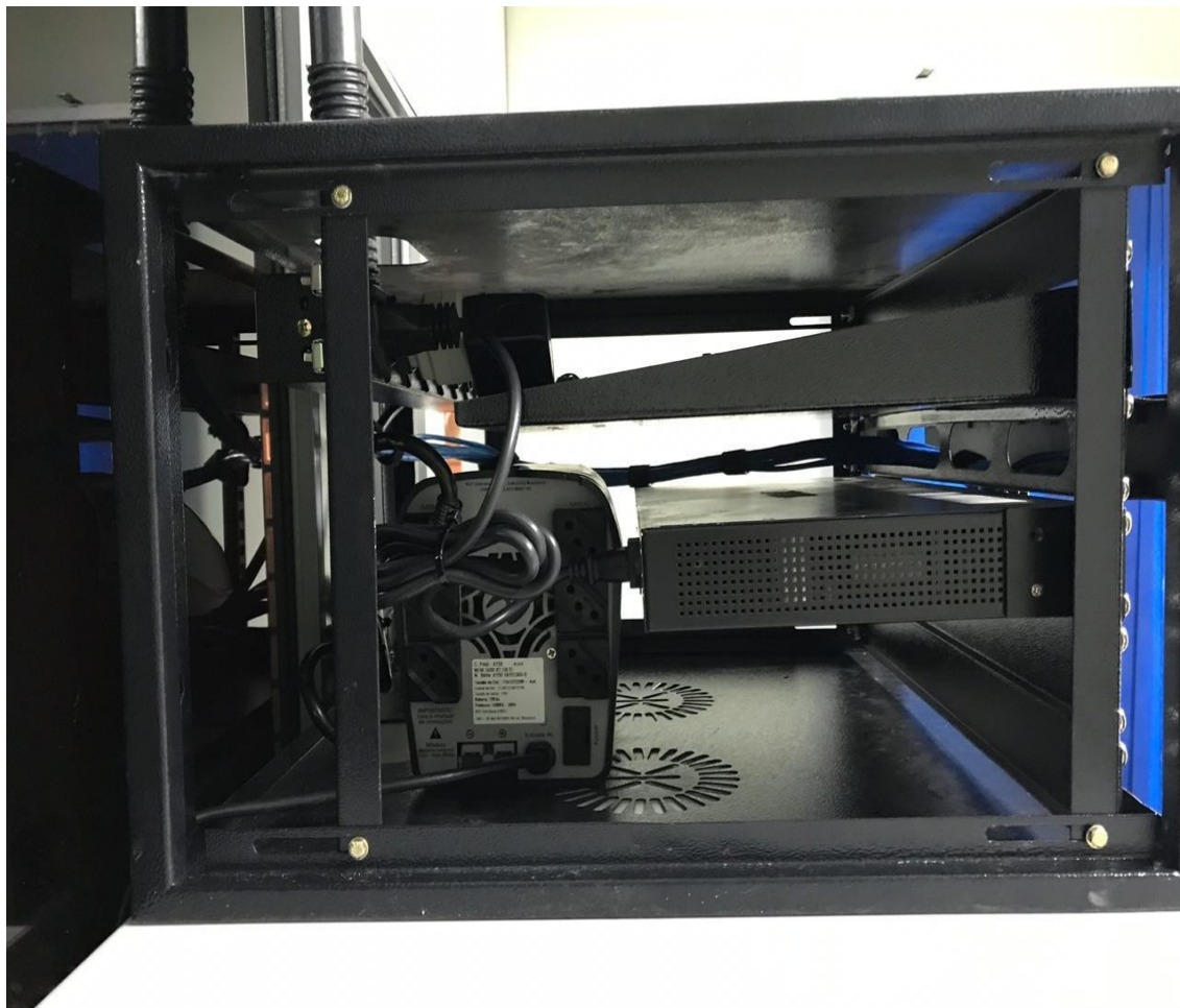
Lateral esquerda - cabos de energia

Prefeitura do Município de Francisco Morato