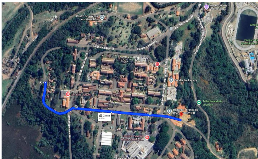
Croqui 3 – CAPS x Policlínica – Distância de 650 metros

Renata Massela de Lima Parreira Engenheira Civil – CREA Nº 2.608.904.327