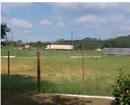
Campo de Futebol