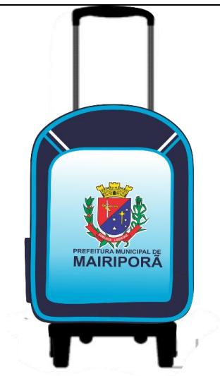
Mochila Escolar Infantil com Carrinho

"Mochila com corpo principal confeccionada em tecido conforme TECIDO 01 (a seguir), na cor aproximadamente "PANTONE 19-3940 TPX" CONFORME LAYOUT, com abertura principal através de zíper nº 8, em nylon, com dois cursores metálicos na cor aproximadamente Preta (laudo com mínimo de 500 ciclos sem avaria e certificado OEKO-TEX do fabricante).