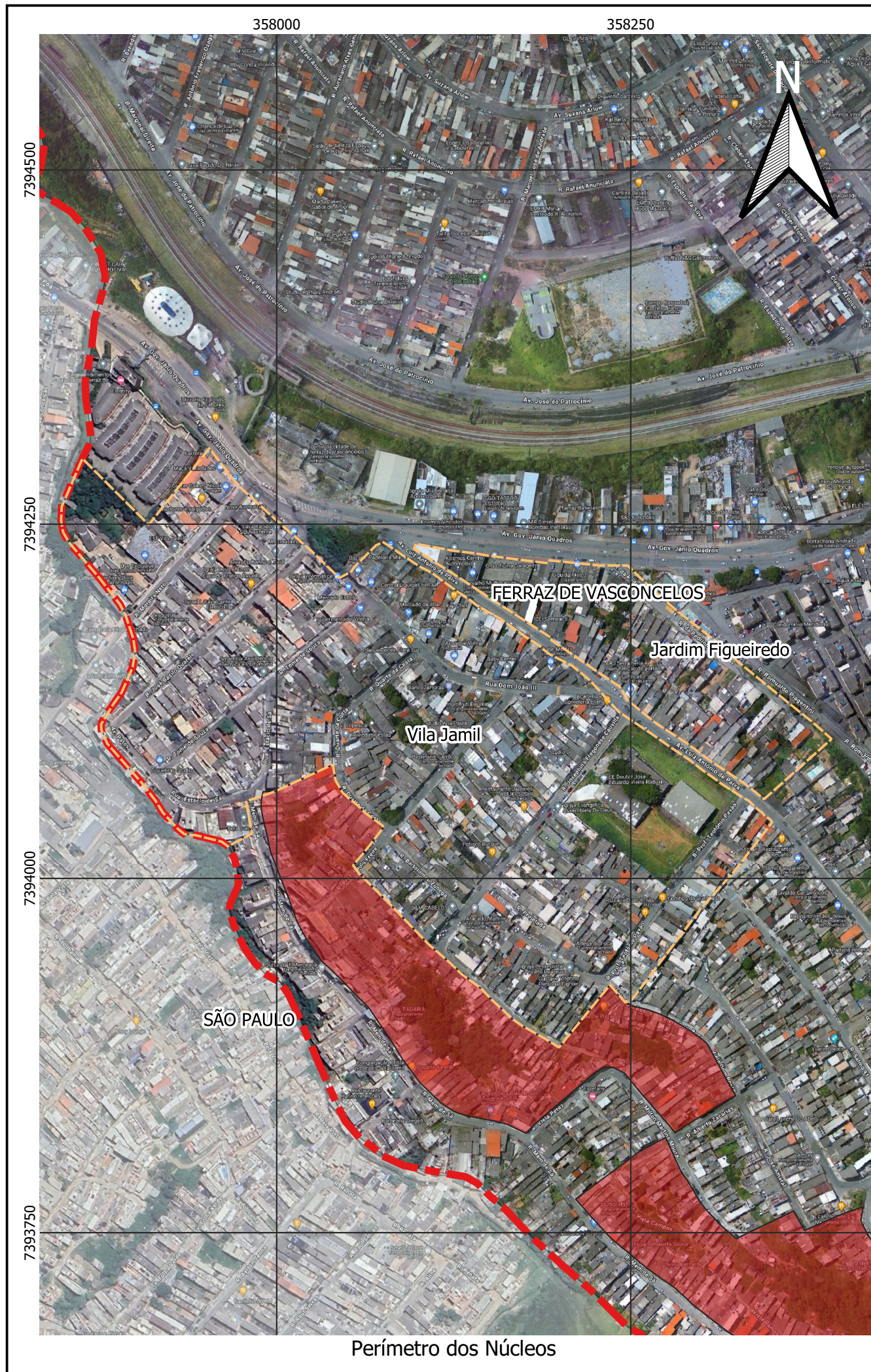
Perímetro dos Núcleos