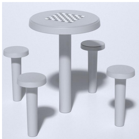
Fig 03 – Conjunto de mesa redonda em concreto – Imagem para referência.