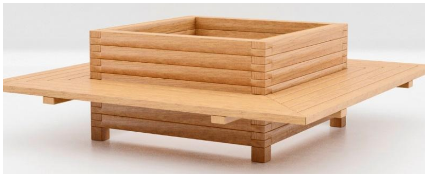
Fig 08 – Floreira quadrada – Imagem para referência.