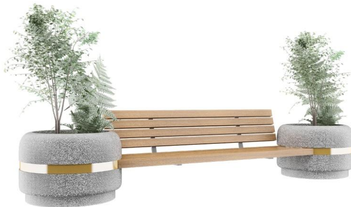
Fig 04 – Par de floreiras em concreto armado – Imagem para referência.