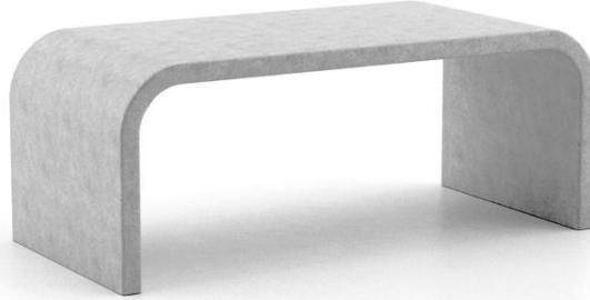
Fig 02 – Banco reto pequeno – Imagem para referência.