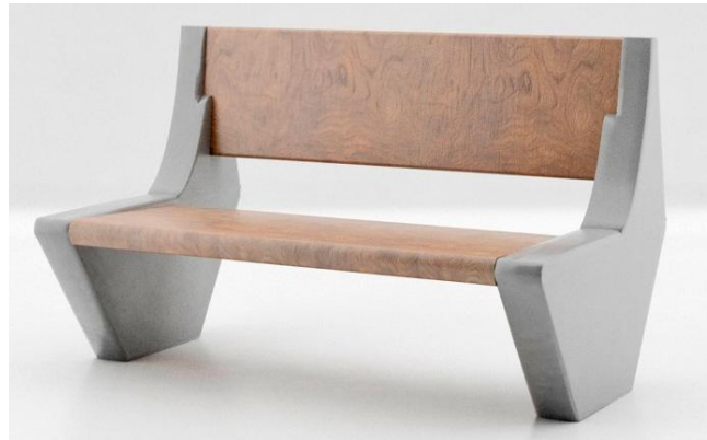
Fig 05 – Banco de madeira e concreto – Imagem para referência.