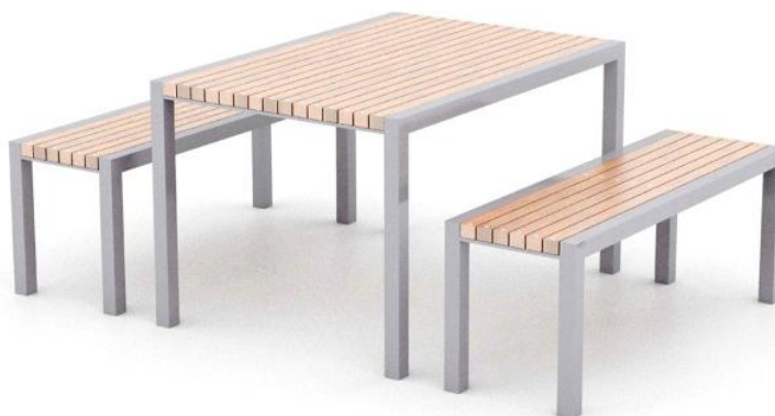
Fig 07 – Conjunto de mesa e bancos – Imagem para referência.