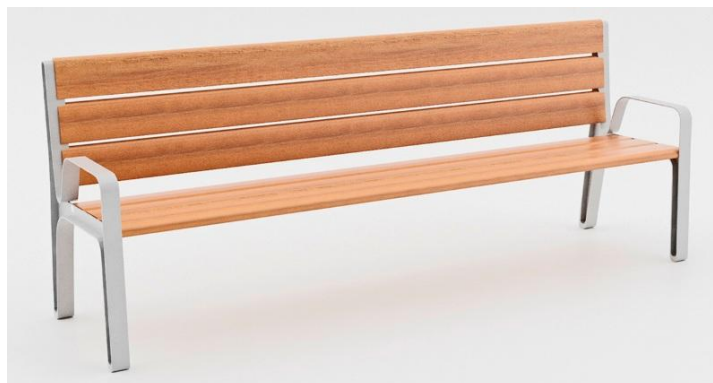
Fig 06 – Banco de madeira e alumínio – Imagem para referência.