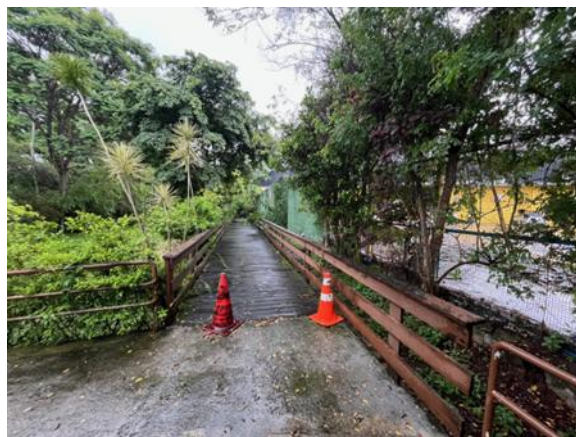
Vista da ponte de acesso

A Prefeitura de Mogi das Cruzes implementou o Programa Mais Mogi Ecotietê, uma iniciativa estratégica para promover um desenvolvimento urbano ordenado e sustentável, atendendo as várias necessidades da cidade, incluindo saneamento ambiental, práticas socioambientais responsáveis, melhoria da mobilidade urbana e crescimento urbano eficiente. O programa se destaca por seu compromisso com a conservação do Rio Tietê, mantendo um equilíbrio entre a expansão urbana e a preservação ambiental, alinhado com o Plano Diretor do município.