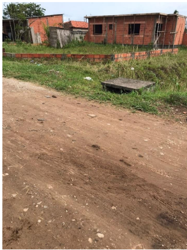
Imagem 2 - Detalhe do do solo existente.

3.1 - TRANSPORTE COM CAMINHÃO BASCULANTE DE 18 M 3 , EM VIA URBANA PAVIMENTADA, DMT ATÉ 30 KM (UNIDADE: M3XKM). AF_07/2020: O material para reforço de subleito será transportado de jazida e terá as características mencionadas no item 3.3. Mapa de jazida no “ANEXO 1” dos documentos.