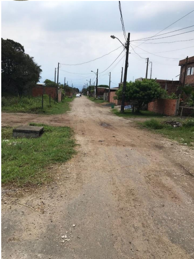
Imagem 1-vista geral da Avenida 6