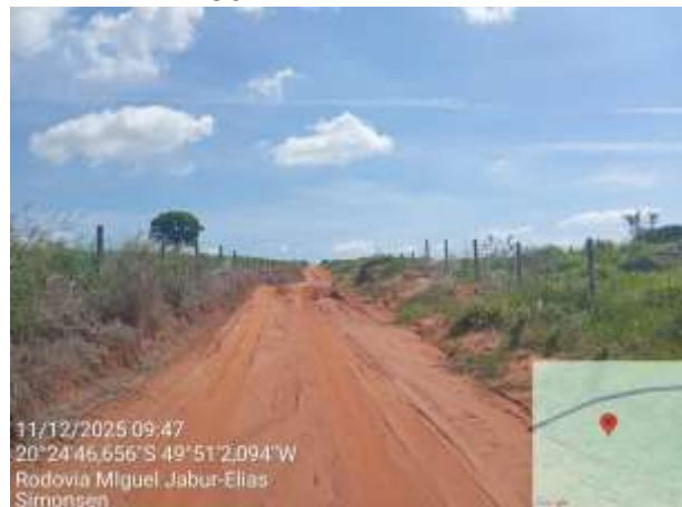
AVF - 392