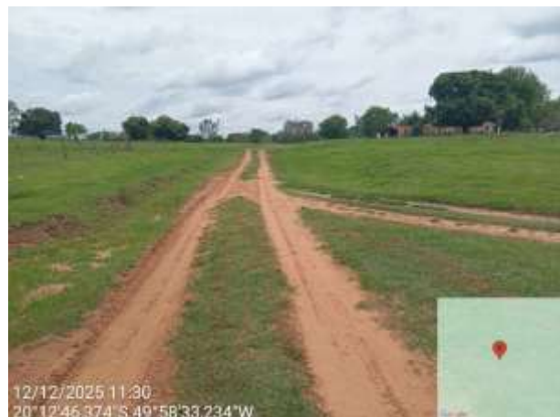
AVF - 413