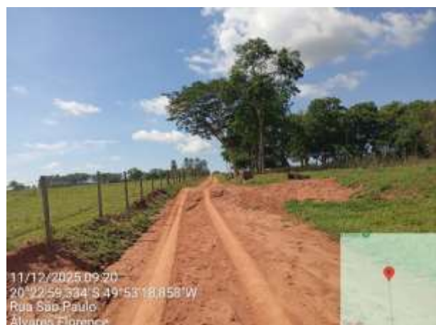
AVF - 378