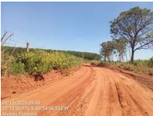
AVF - 332