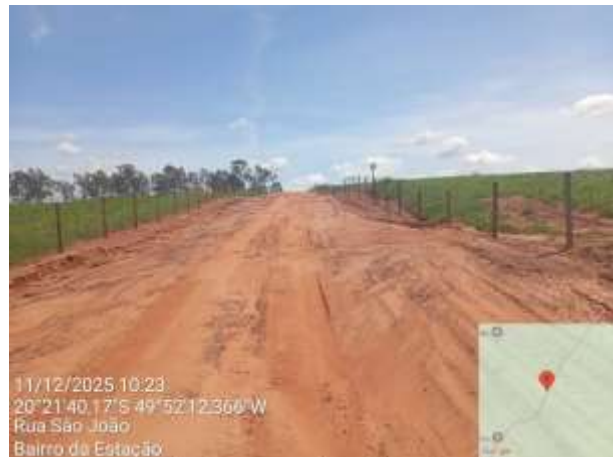
AVF - 344