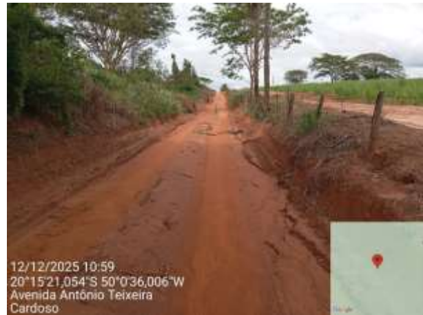
AVF - 425