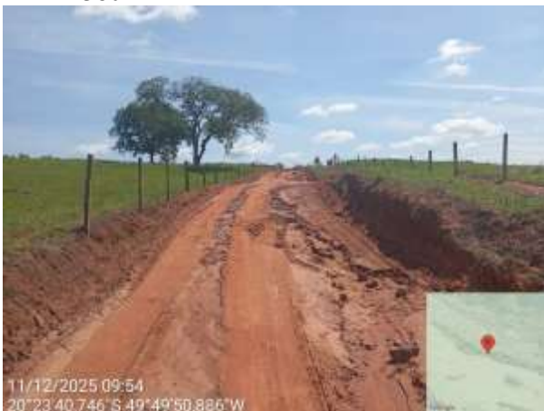
AVF - 391