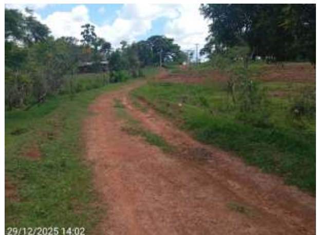
AVF – 178