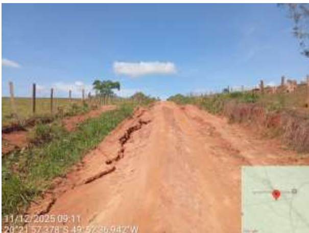
AVF - 369