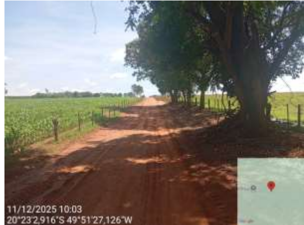
AVF - 381