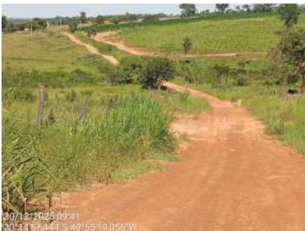
AVF – 164