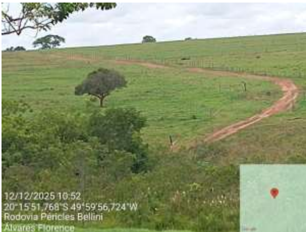
AVF - 429