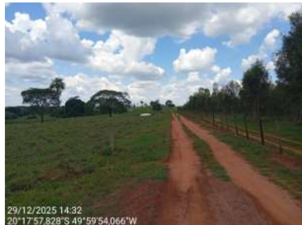
AVF - 438