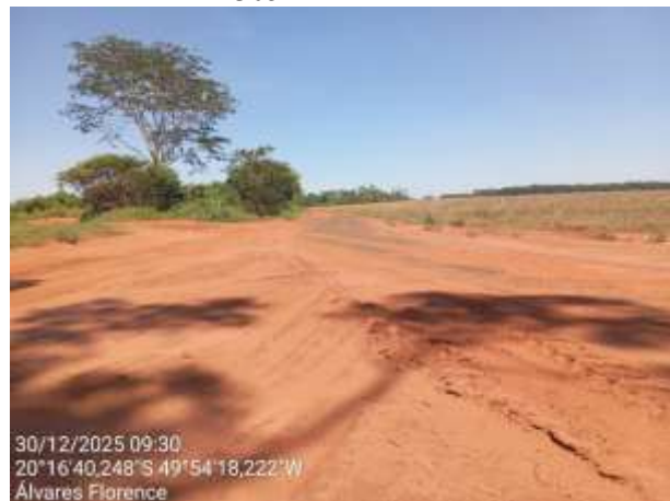
AVF - 338