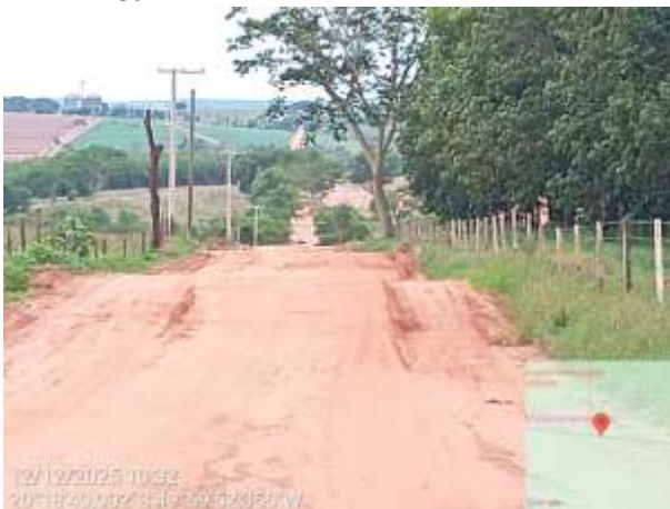
AVF - 446