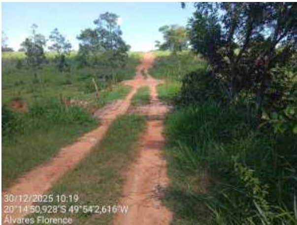
AVF - 422