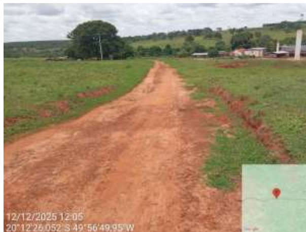
AVF - 501