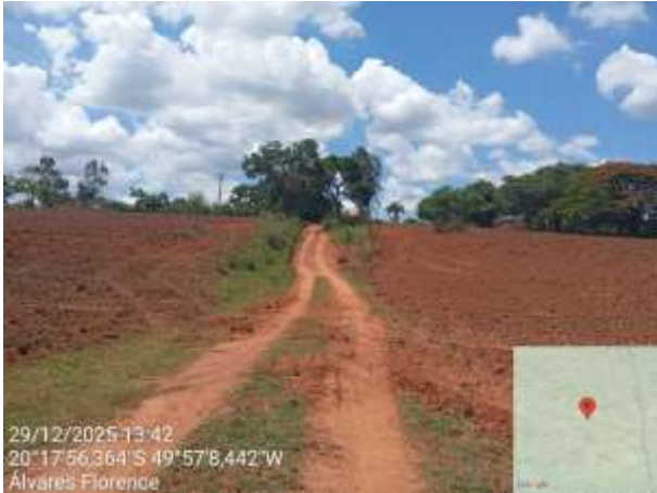
AVF - 360