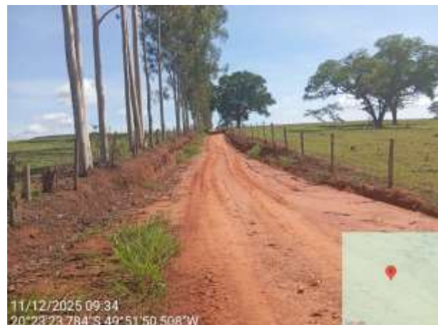
AVF - 488