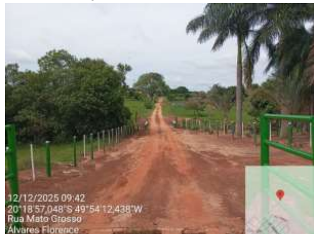
AVF - 448