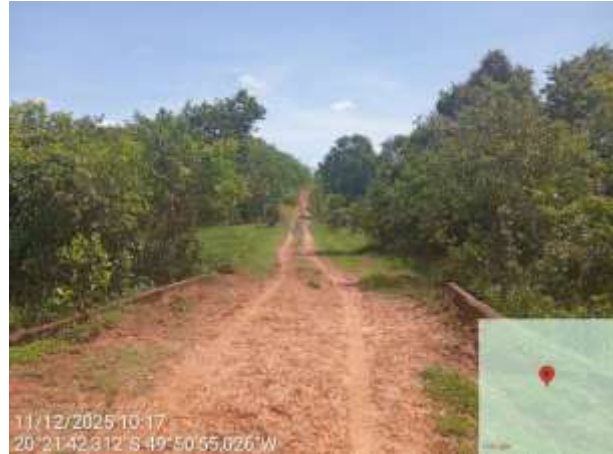
AVF - 367