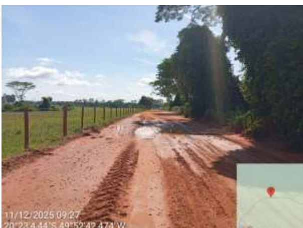
AVF - 377