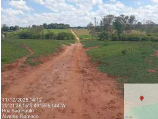
AVF - 380