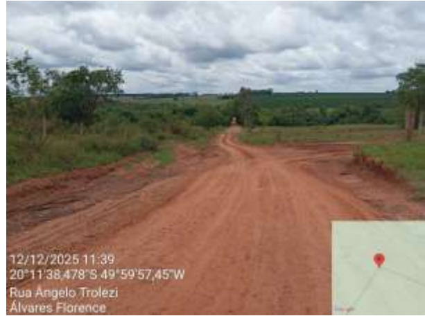
AVF - 305