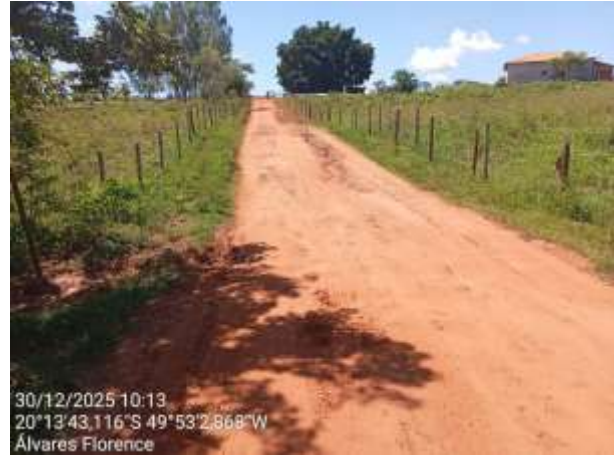
AVF - 420