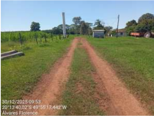
AVF - 418