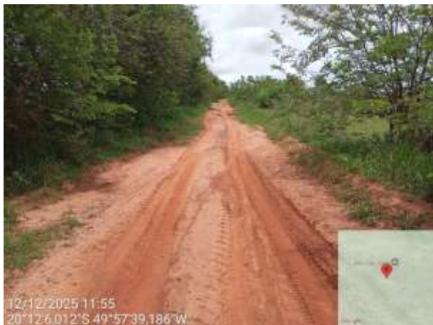
AVF - 500