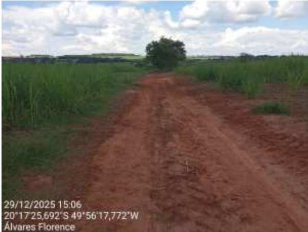
AVF - 439