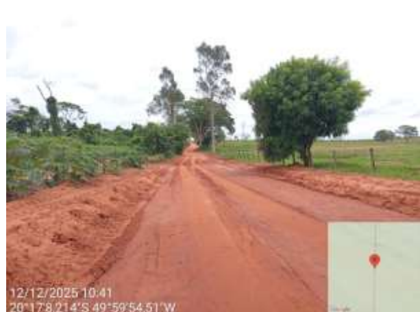
AVF - 370