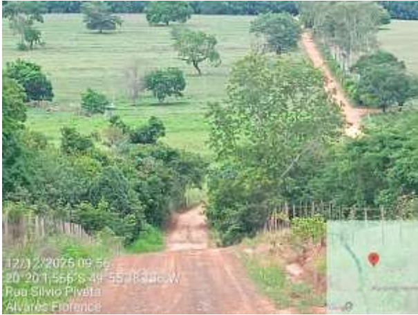
AVF - 262