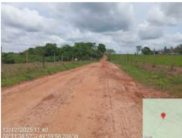
AVF - 406