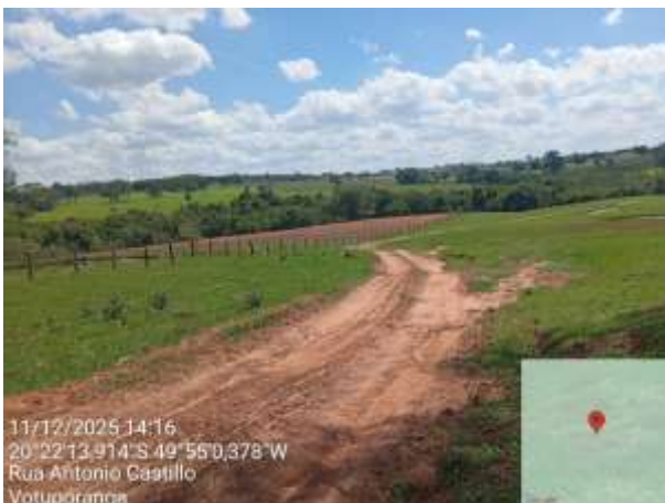
AVF - 478