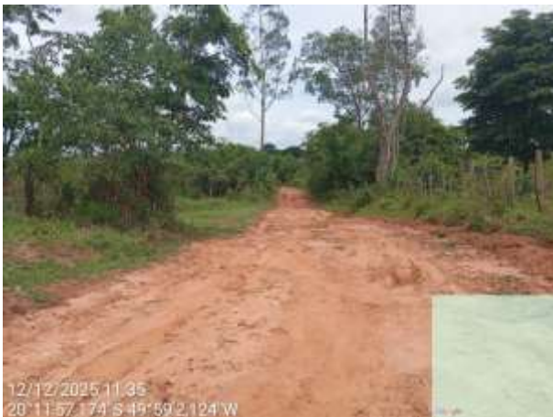
AVF - 342