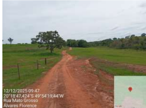
AVF - 445