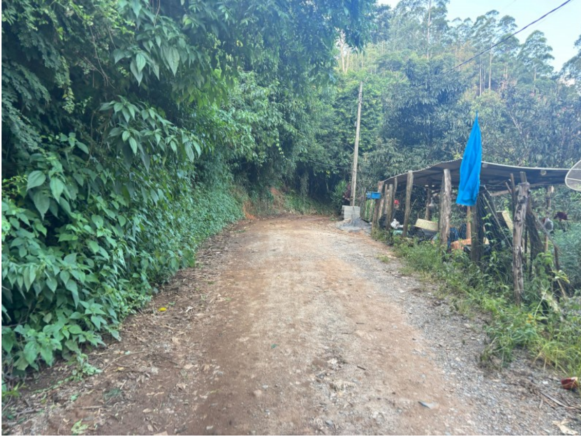
Tipo da imagem: Foto da Rua/Avenida Descrição da foto: IMAG04