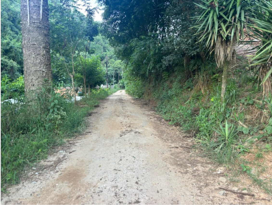
Tipo da imagem: Foto da Rua/Avenida Descrição da foto: IMAG02