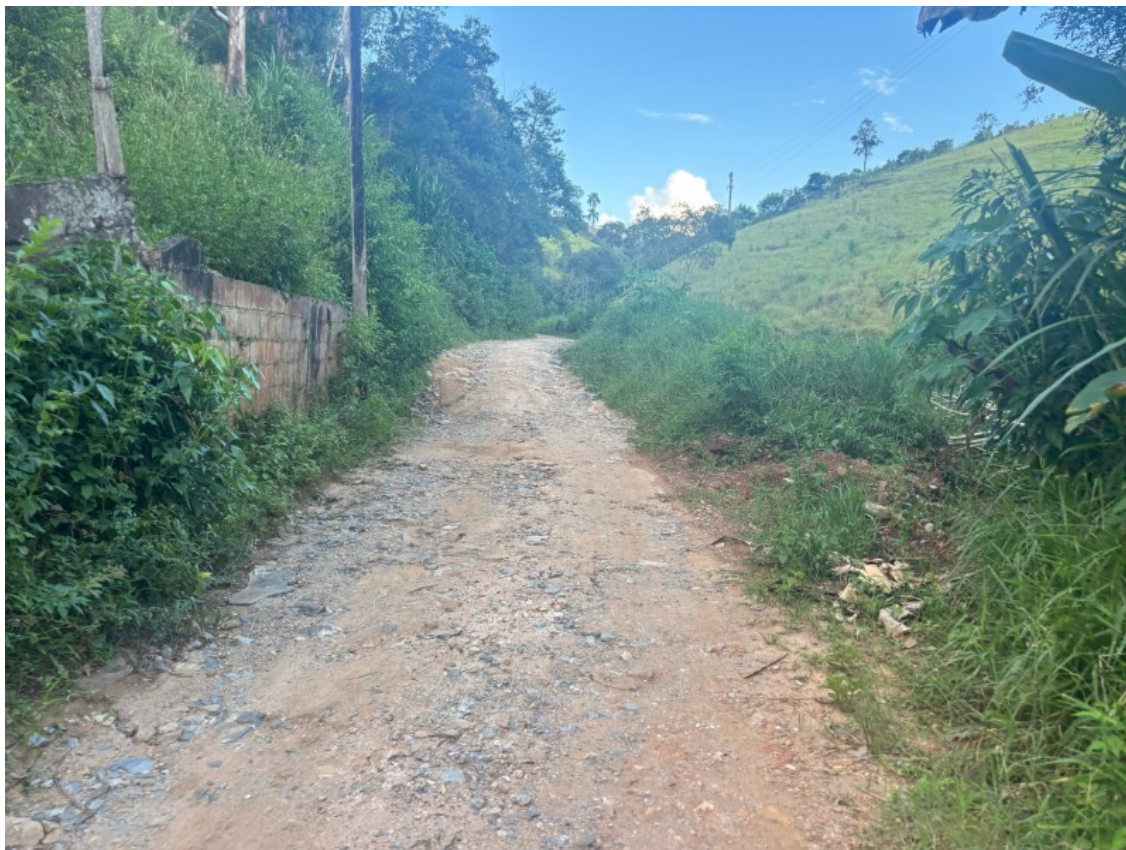
Tipo da imagem: Foto da Rua/Avenida Descrição da foto: IMAG05