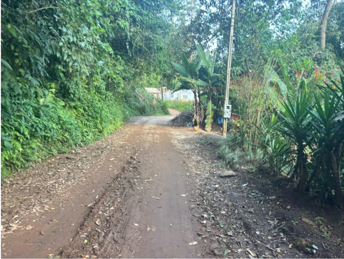
Tipo da imagem: Foto da Rua/Avenida Descrição da foto: IMAG03