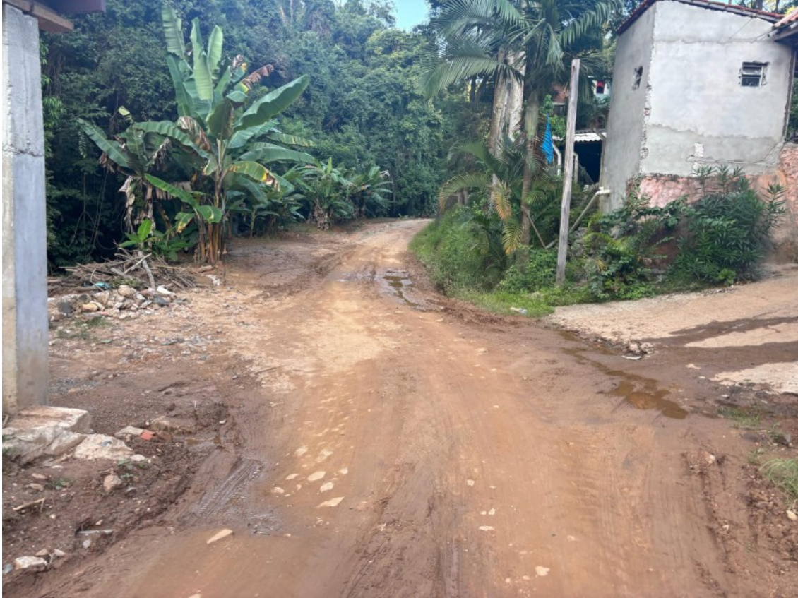
Tipo da imagem: Foto da Rua/Avenida Descrição da foto: IMAG01