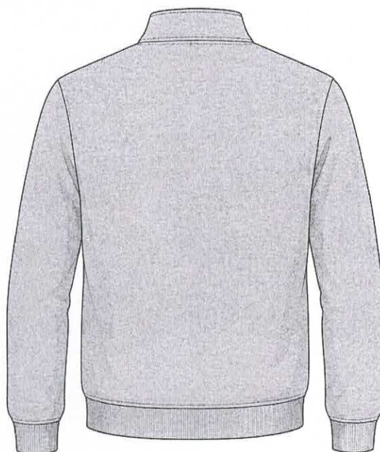
DETALHE DA ESTAMPA