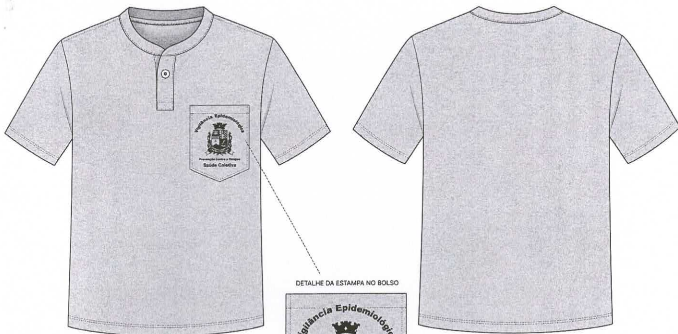
DETALHE DA ESTAMPA NO BOLSO