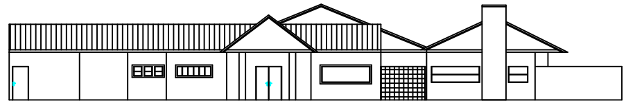
FACHADA Esc.: 1/100