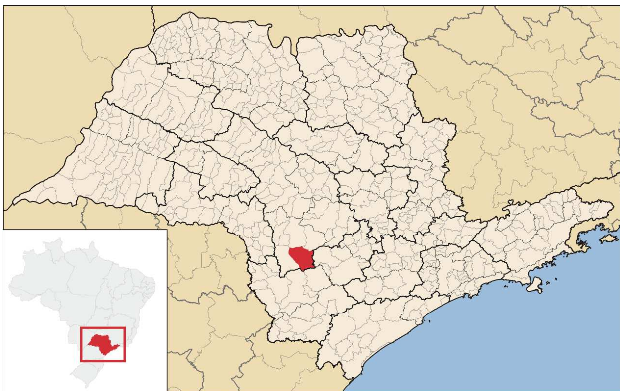
IMAGEM 01: Localização do município de Paranapanema no Estado de São Paulo.

Paranapanema é um município brasileiro do estado de São Paulo. Localiza-se a sudoeste do estado, com uma latitude 23°23'19" sul e a uma longitude 48°43'22" oeste, estando a uma altitude de 610 metros. Sua população em 2021 era de 20.588 habitantes.