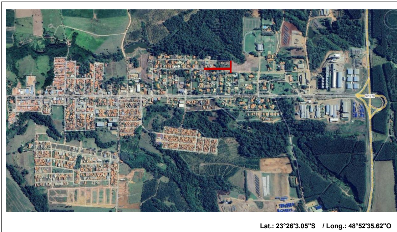
IMAGEM 02: Imagem aérea google Earth, com a localização do empreendimento.

O empreendimento será implantado nas Ruas das Calêndulas e das Rosas.