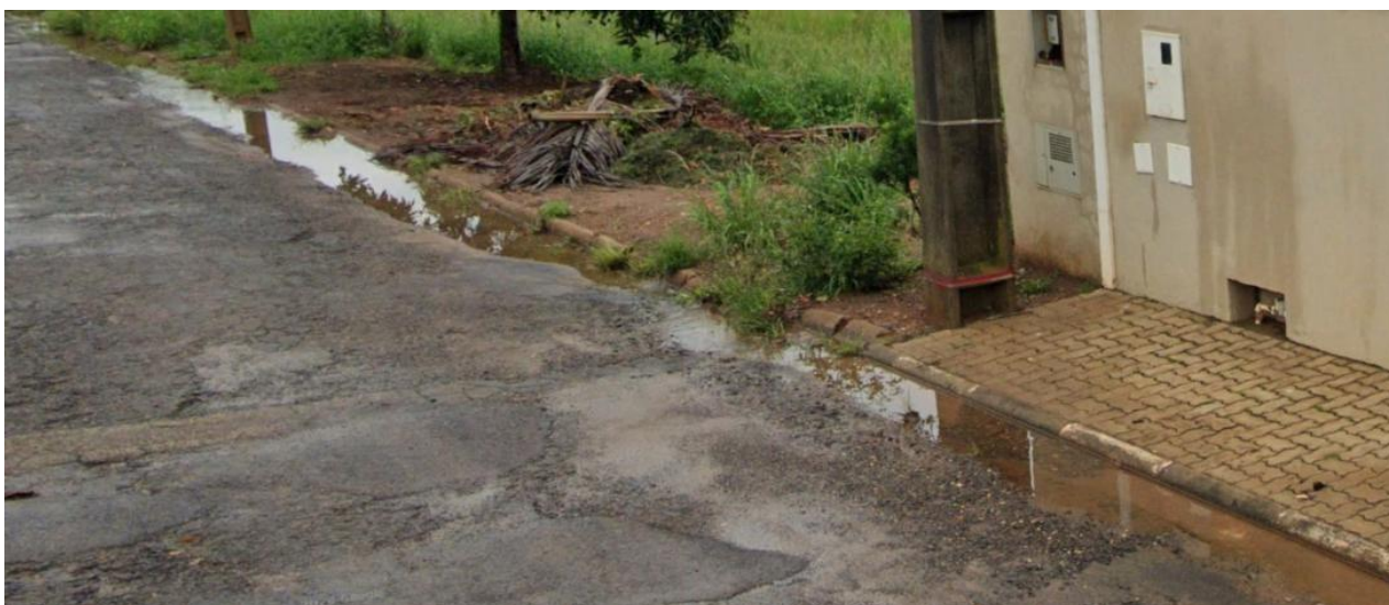
Foto dos danos causados pelas inundações na Rua das Calêndulas.