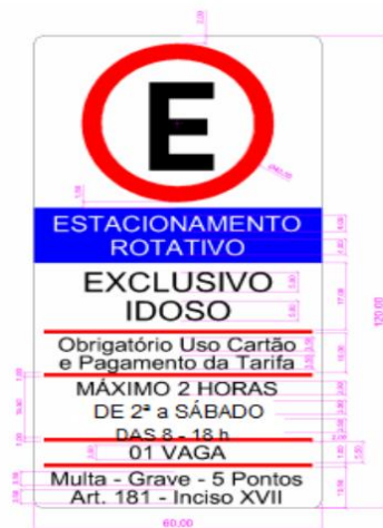
*Placa de Estacionamento Rotativo "Idoso"

As Vagas para Carga e Descarga devem estar devidamente sinalizadas conforme estabelece as resoluções específicas, do Conselho Nacional de Trânsito – CONTRAN, e são destinadas exclusivamente a operação de carga e descarga. Estas vagas são isentas do pagamento da respectiva tarifa, porém respeitando o limite de tempo na sua utilização conforme descrito na sinalização vertical.