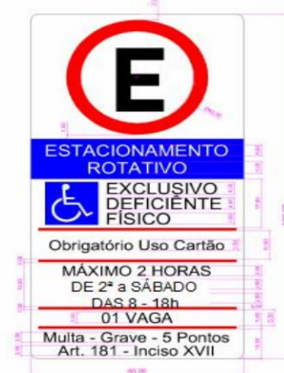
*Placa de Estacionamento Rotativo "Deficiente Físico"