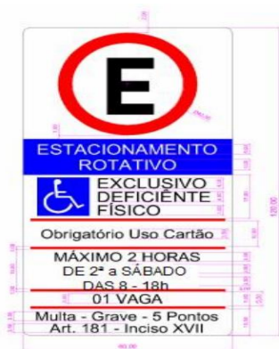
*Placa de Estacionamento Rotativo "Deficiente Físico"

As Vagas para PCD devem estar devidamente sinalizadas conforme estabelece a resolução 965, de 17 de maio de 2022, do Conselho Nacional de Trânsito – CONTRAN, e são destinadas exclusivamente a veículos utilizados (conduzidos ou não) por Pessoas com Deficiência – PCD, sendo obrigatório o veículo estar identificados com a credencial fornecida pelo PODER CONCEDENTE . Estas vagas são isentas do pagamento da respectiva tarifa, porém respeitando o limite de tempo na sua utilização conforme descrito na sinalização vertical.