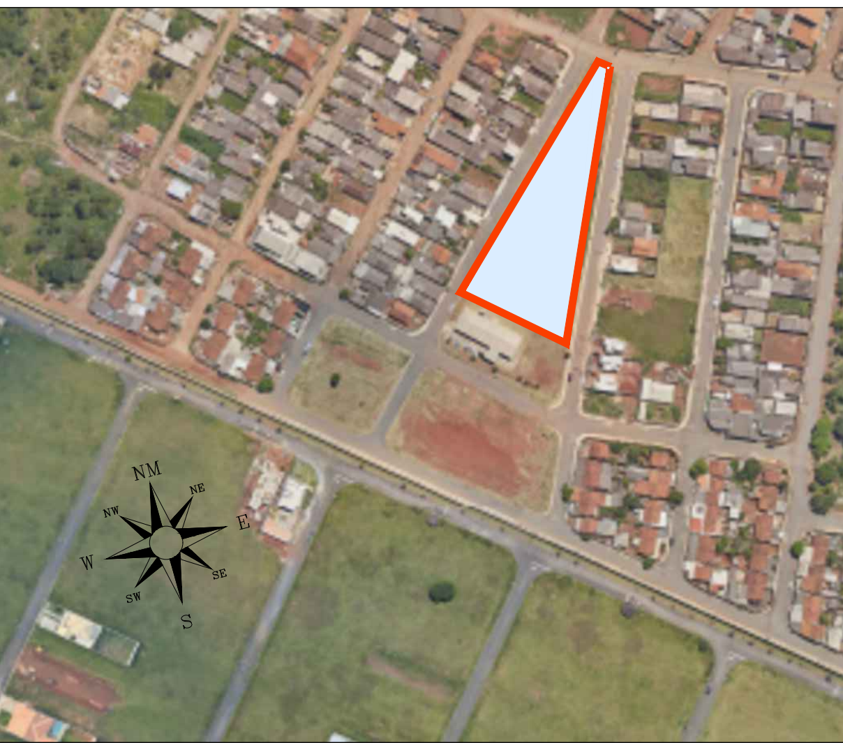
SITUAÇÃO Sem Escala