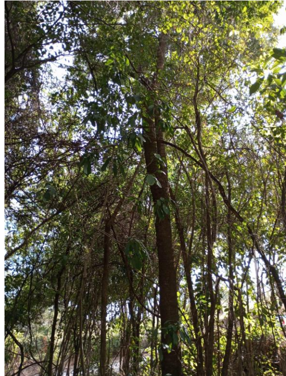
Foto 6. Local 2 - Rua Batalha do Paissandu. Interior do fragmento onde será executada a EEAT (Estação elevatória de água tratada).