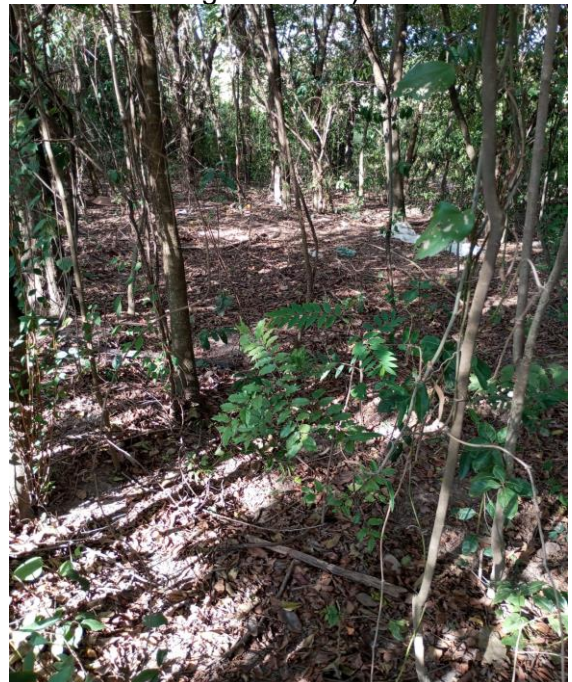
Foto 8. Local 2 - Rua Batalha do Paissandu. Interior do fragmento onde será executada a EEAT (Estação elevatória de água tratada) com a presença de árvores regenerantes.