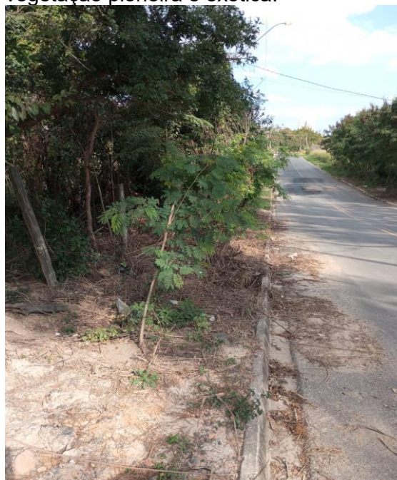
Foto 4. Local 2 - Rua Batalha do Paissandu. Área verde do loteamento Jaraguá, vegetação pioneira e exótica.