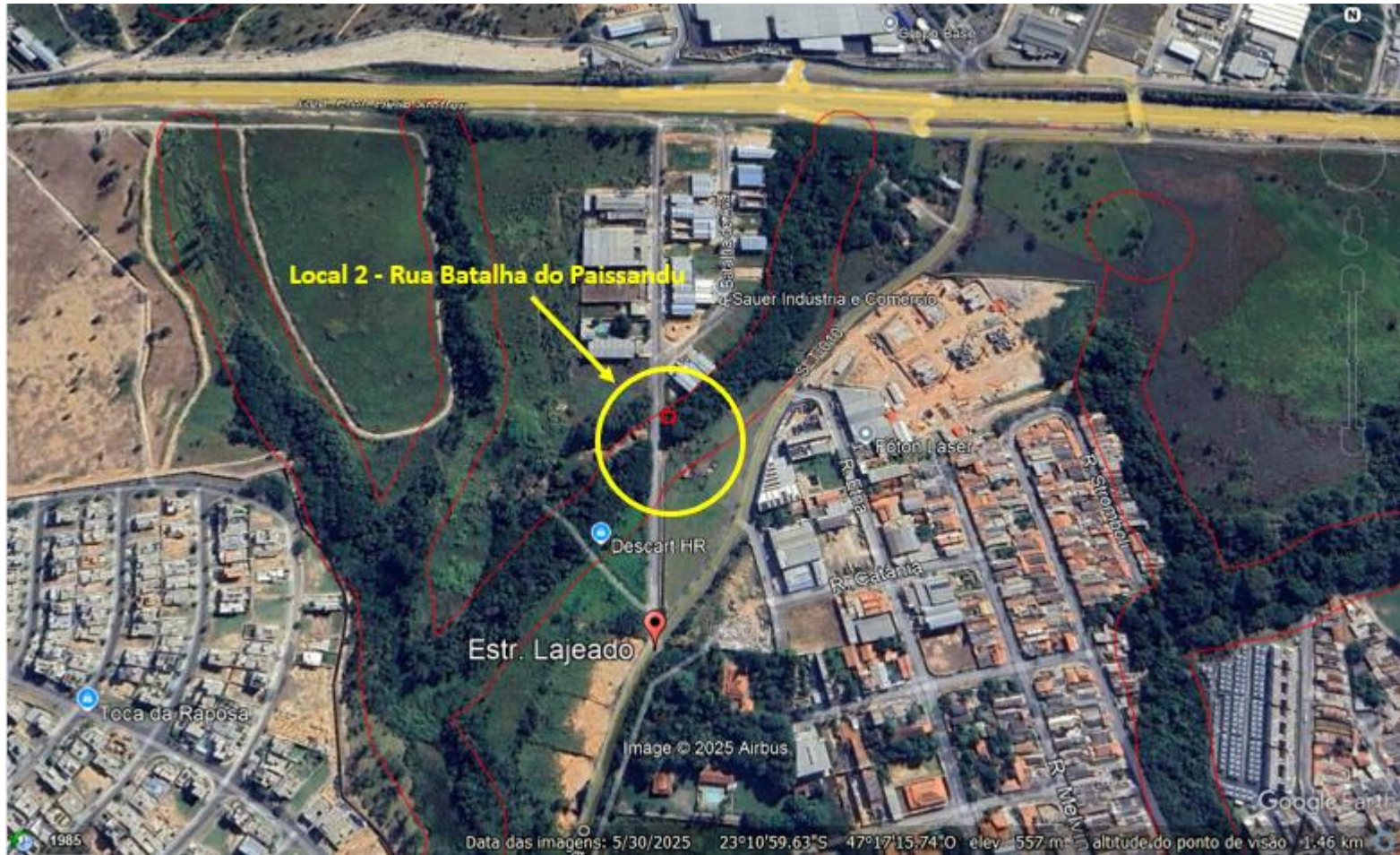
Figura 3 – Croqui de localização do local de Intervenção 2 - Rua Batalha do Paissandu.