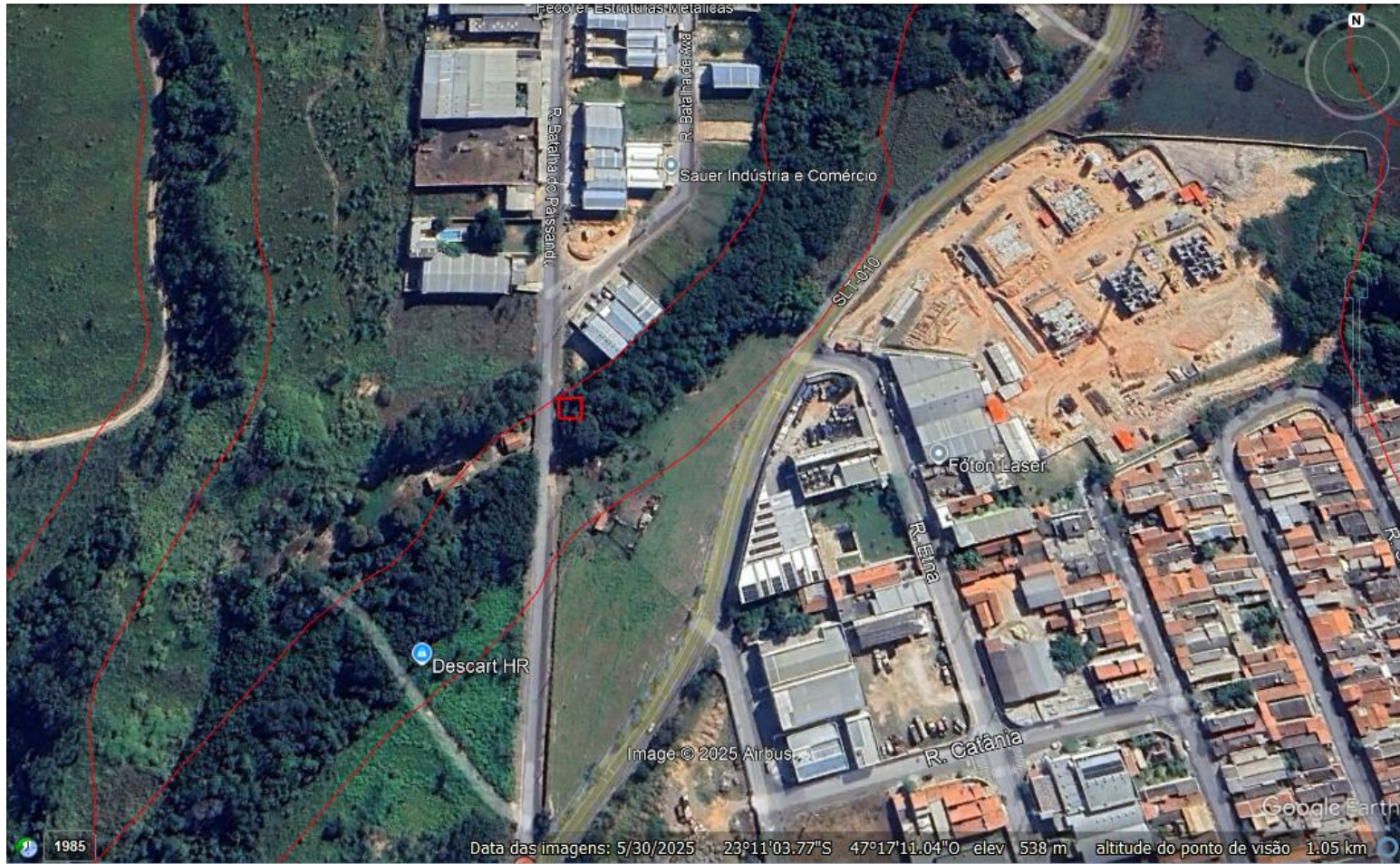
Figura 4 – Croqui de localização do local de intervenção para a execução da EEAT - Estação elevatória de água tratada.