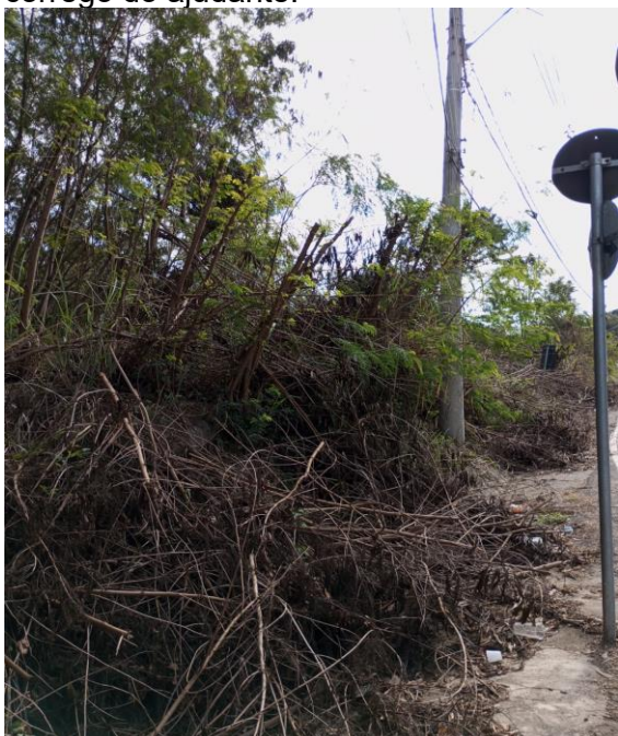
Foto 3. Local 1 - Estrada Lajeado, APP córrego do Ajudante, vegetação pioneira e exótica.