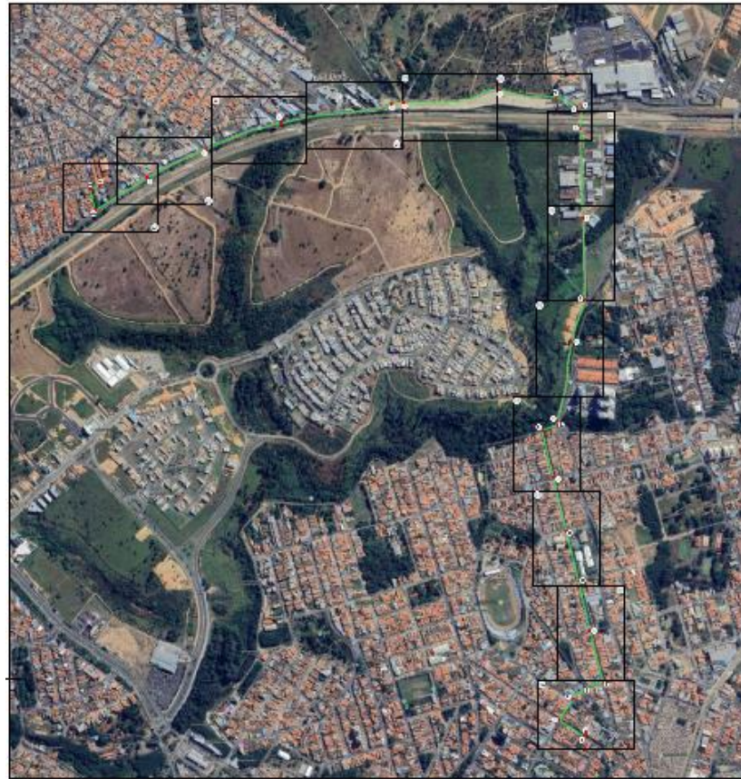
1 Traçado adutora ETA Bela Vista _ CR Nova Era ESCALA 1:7500