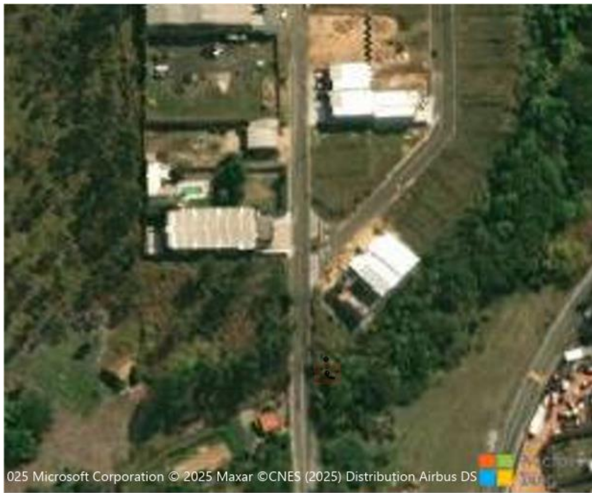
Figura 5 – Detalhe do Projeto de execução da EEAT - Estação elevatória de água tratada.