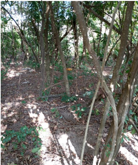
Foto 7. Local 2 - Rua Batalha do Paissandu. Interior do fragmento onde será executada a EEAT (Estação elevatória de água tratada) com a presença de serrapilheira.