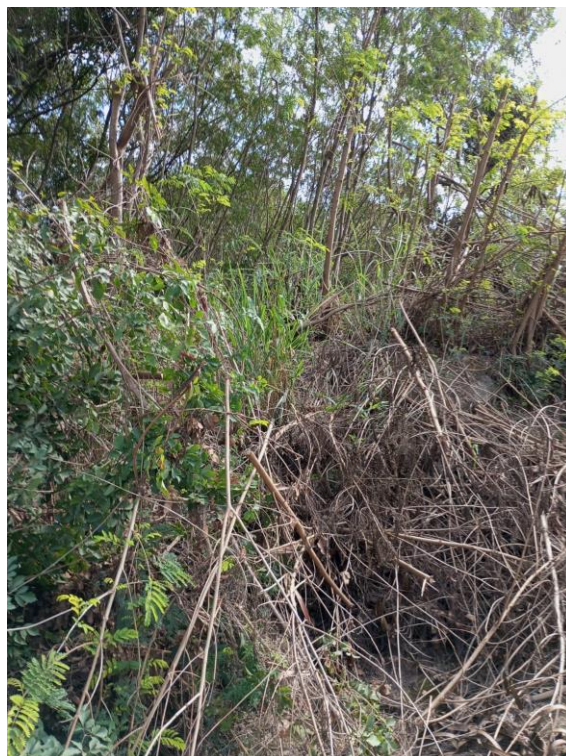
Foto 2. Local 1 - Estrada Lajeado, vegetação pioneira e exótica.