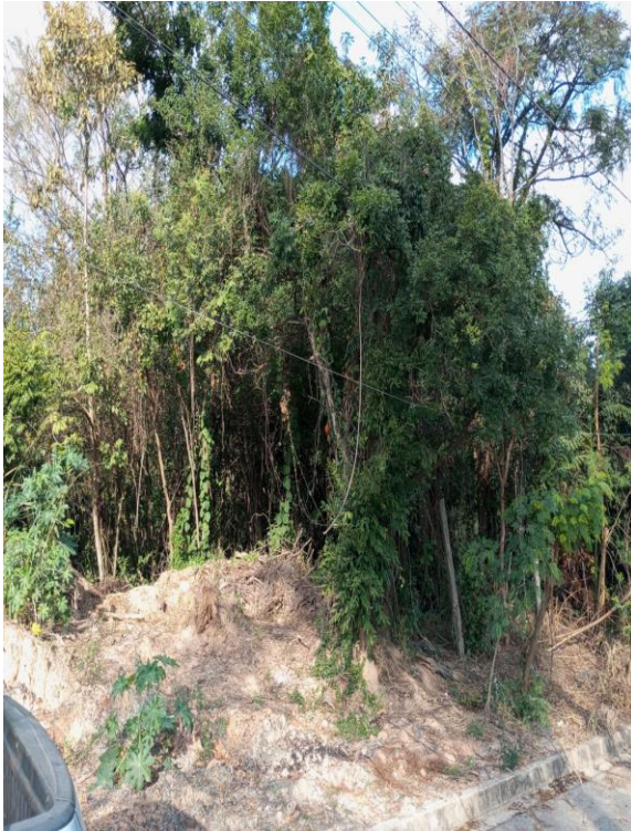
Foto 5. Local 2 - Rua Batalha do Paissandu. Borda do fragmento onde será executada a EEAT (Estação elevatória de água tratada).