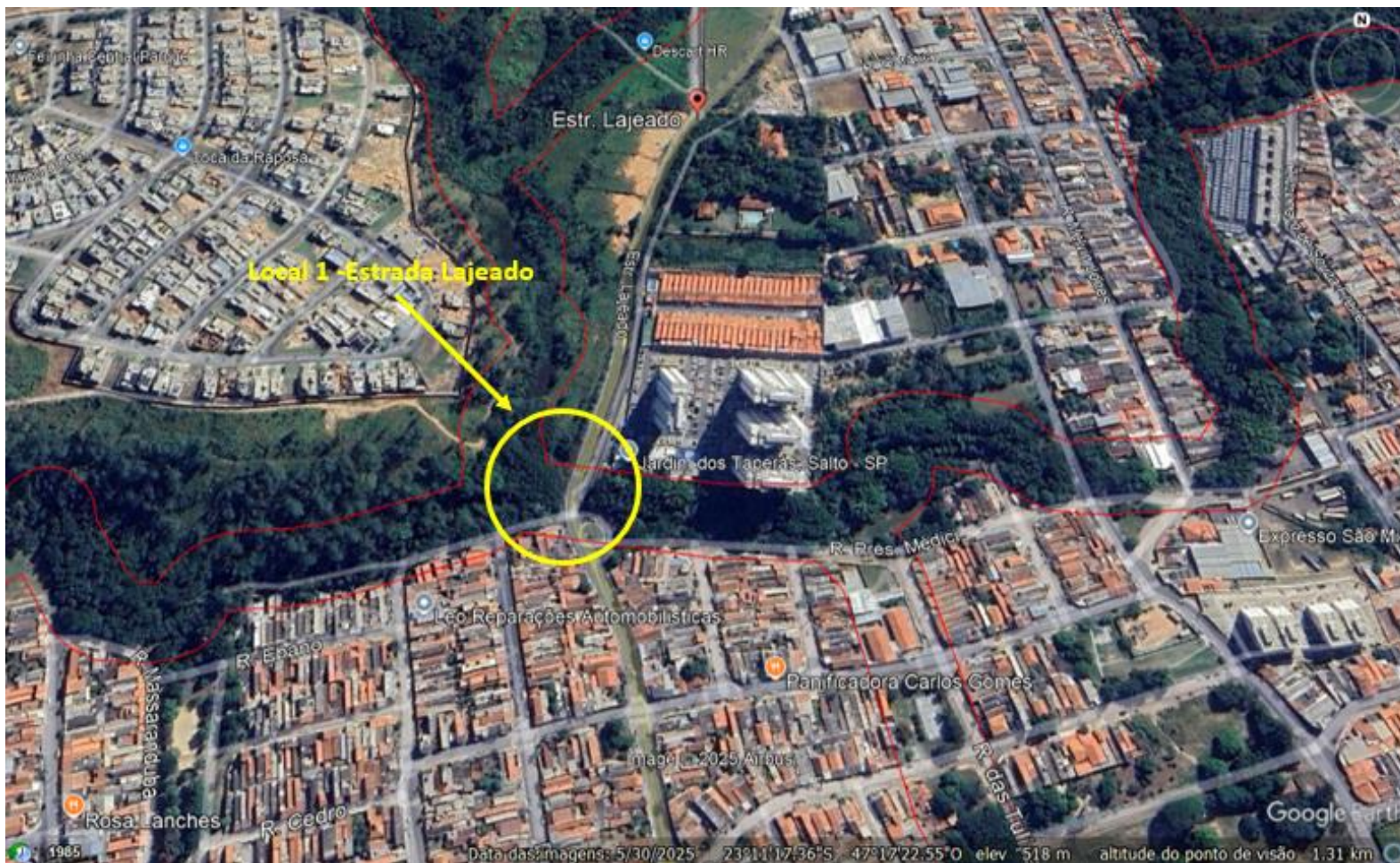
Figura 2 – Croqui de localização do local de Intervenção 1 - Estrada Lajeado.