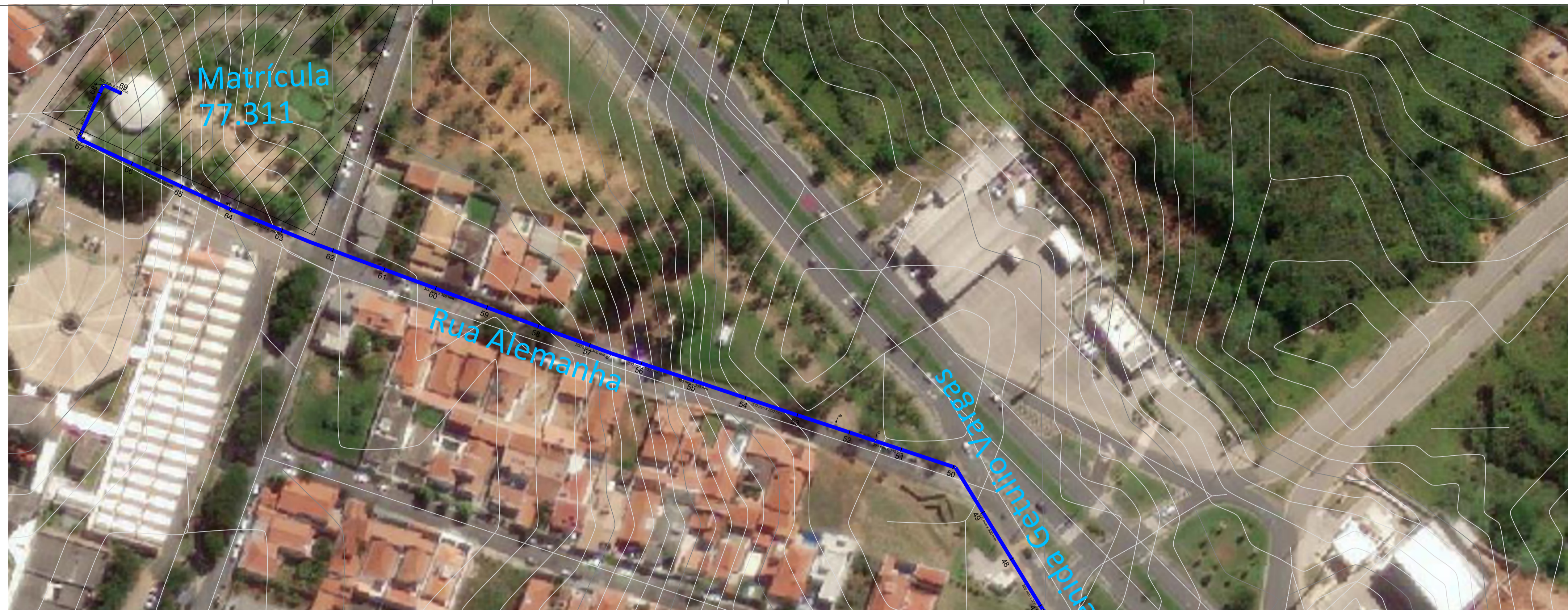
PERFIL TRECHO - (1)