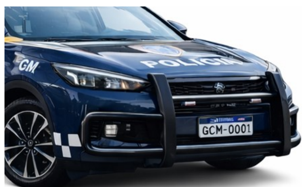
Figura 2 - foto ilustrativa: Quebra mato frontal e traseiro modelo

3.4.27.3. Quebra-mato frontal e traseiro, sendo o modelo frontal composto por duas barras redondas, com no mínimo 2 polegadas de diâmetro e espessura mínima de 2 mm, com distância de 30 cm entre as barras e 10 cm entre a barra e o para-choque. As barras são projetadas para proteger integralmente a parte frontal da viatura, com ênfase na proteção do para-choque e dos faróis contra colisões. O modelo traseiro consiste em uma barra única redonda, com no mínimo 2 polegadas de diâmetro e espessura mínima de 2 mm, com distância de 10 cm entre a barra e o para-choque traseiro, desenvolvida para proporcionar proteção total ao para-choque traseiro. Ambas as barras devem ser na cor preta, fixadas de forma robusta ao chassi, sendo soldadas, com todas as emendas reforçadas, garantindo maior durabilidade e segurança. O design deverá seguir rigorosamente o modelo ilustrado na imagem abaixo, com tolerância de 5% para mais ou para menos, podendo ser ajustado a critério do contratante.