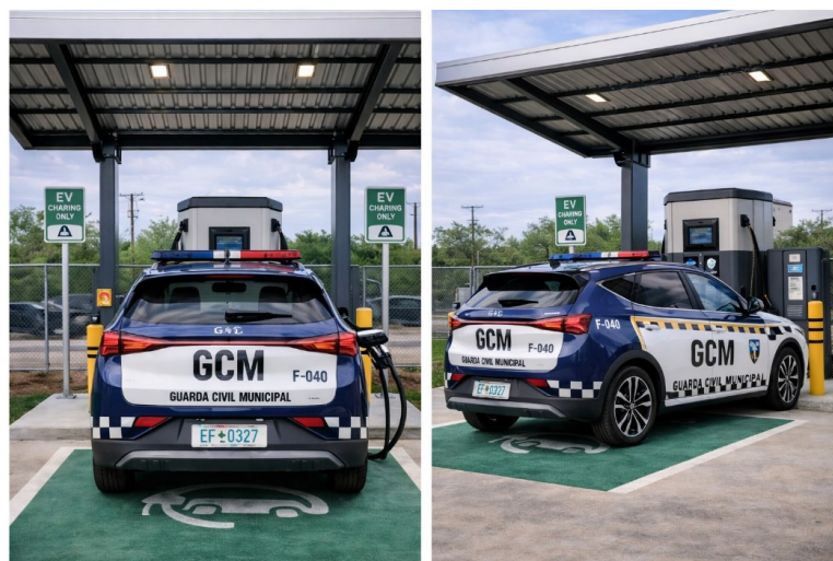
Figura 1 - imagem ilustrativa da área de recarga.