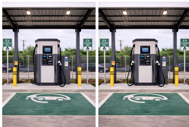
Figura 5 - imagem ilustrativa: eletroposto com 1 e 2 conectores simultâneos

3.4.35.9. Deverá ser assegurado que dois veículos possam ser carregados simultaneamente, do estado de carga de 0% (zero por cento) a 100% (cem por cento), no prazo máximo de 1 (uma) hora e 30 (trinta) minutos cada, sem perda de desempenho ou redução da potência nominal durante todo o processo de carregamento, observadas as condições técnicas recomendadas pelo fabricante dos veículos e os requisitos de segurança aplicáveis.