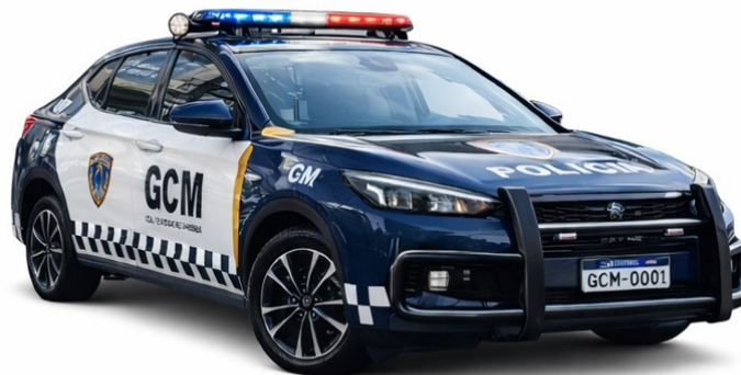
Figura 1 – imagem ilustrativa: Luz de Beco modelo

3.4.22.3. O centro do feixe de luz deverá formar um ângulo de 20 (vinte) a 45 (quarenta e cinco) graus com o a dianteira do veículo.