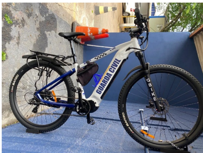
Figura 1 - Imagem das bicicletas