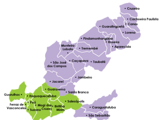
Guaratinguetá - Localização na Região do Vale do Paraíba