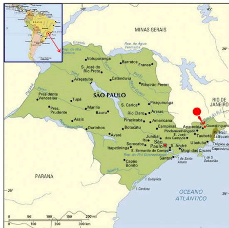
Guaratinguetá - Localização no Estado

O índice de urbanização é elevado, com a maioria das vias pavimentadas. O centro histórico mistura construções antigas com edifícios imponentes, possuindo vias estreitas e com tráfego congestionado. A expansão em direção à periferia revela bairros planejados, com poucos prédios altos, mas densamente povoados, apresentando avenidas, rotatórias e vias modernas que facilitam o trânsito.